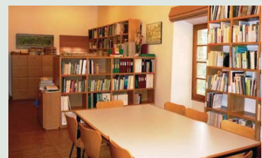
Interior de la biblioteca de la Rectoria Vella

Per a la consulta del fons es recomana la concertació de visita via telefònica o Internet. Rectoria Vella. Parc de la Rectoria Vella s/n 08470 Sant Celoni Tel. 93 864 12 13 - Fax 93 867 57 28 p.montnegre.cdrector@diba.cat Horari: de dilluns a divendres de 10 a 14 h en hores convingudes