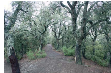
La "rambla" d'alzines sureres arrencades