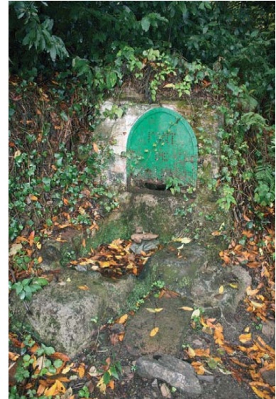
La font de Sant Martí de Montnegre