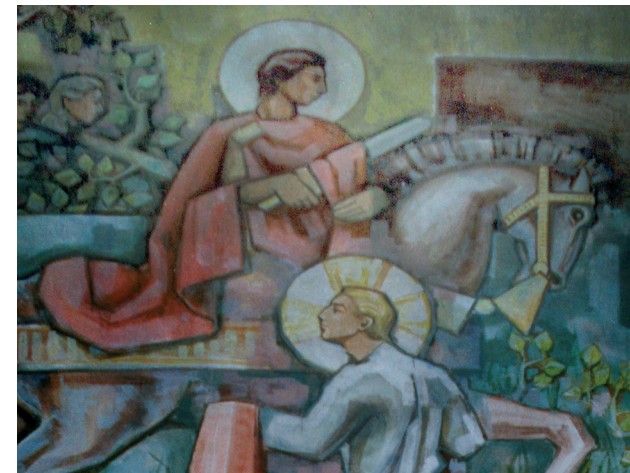
Pintures de l'altar major