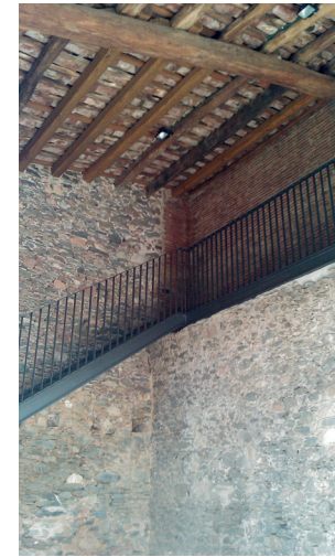
Escala d'accés a dalt de la torre