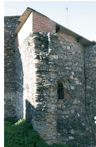
Evolució de les obres

La base atalussada de la torre s'ha deixat descoberta fins a l'alçada on es considera que hi havia el nivell de circulació en els segles XIV-XV.