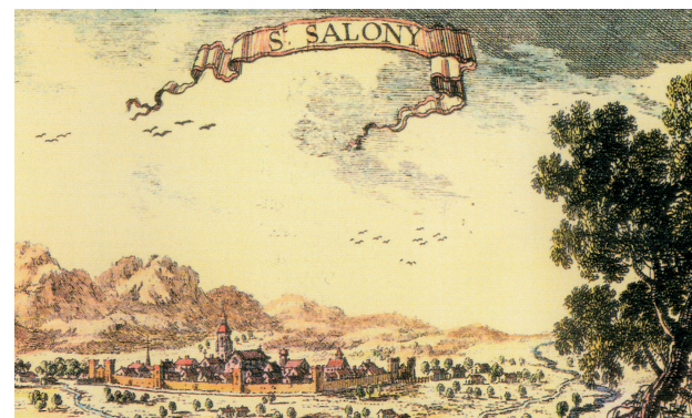
Visió idealitzada de la vila emmurallada. Gravats francès del segle XVII

Després d'aquestes vicissituds, el recinte emmurallat de Sant Celoni es conserva parcialment com a paret mitgera entre les cases del carrer Major i les dels carrers de les Valls i de Sant Roc, i com a façana d'algunes cases de la plaça del Bestiar. De les cinc torres que, com a mínim, tenia originalment el conjunt només se'n conserven dues i l'angle d'una tercera. Entre les dues primeres destaca la torre anomenada de ca l'Aymar, que és perfectament visible des de la plaça de Josep Alfaras. La torre que hi ha al carrer de les Valls és la que s'ha restaurat el 2009.