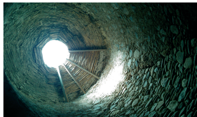
Cúpula interior de la torre