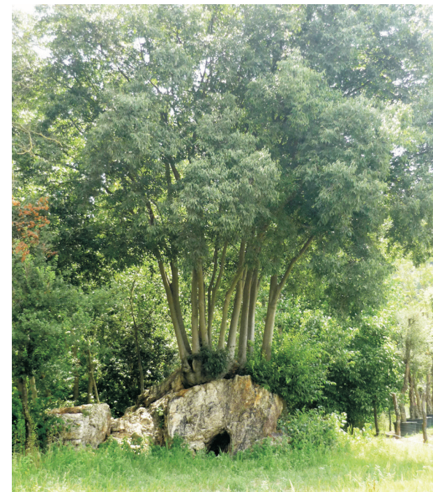
Mides (any 2004) Alçada: 20 m. Perímetre del tronc: 3,7 m Diàmetre de capçada: 23 m