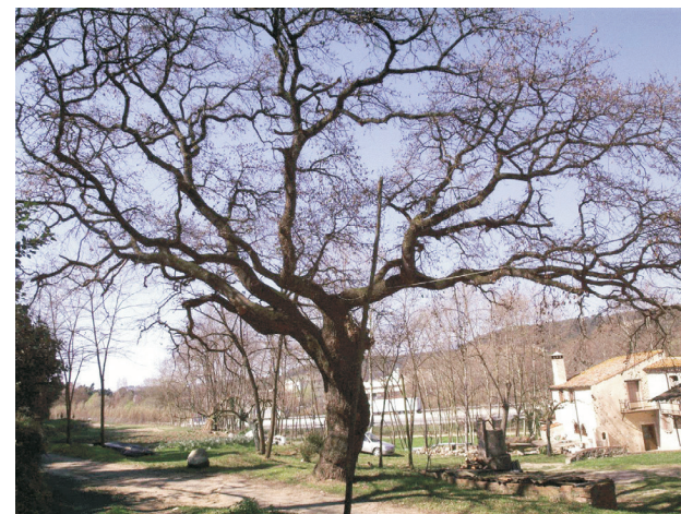
Quercus pubescens L. Roure martinenc Altitud: 115 m

És un dels roures més grans del municipi de Sant Celoni i havia estat encara més gran abans que se li trenqués una de les branques principals, que va caure sobre l'era en temps d'abandonament de l'activitat al molí, després de la Guerra Civil. Sobre la ferida se li van apilonar canyes durant molts anys, cosa que li va produir greus putrefaccions i forats a la fusta fets per escarabats barrinadors.