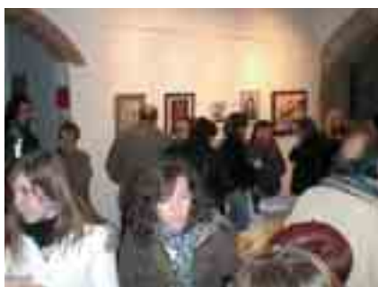
Inauguració de l'exposició de pintura Dones , amb obres dels i les alumnes del curs de Dibuix i Pintura

Amb motiu dels actes de celebració del 8 de març, Dia Internacional de les Dones, les i els alumnes del curs de Dibuix i pintura hi han participat, amb una exposició centrada en la imatge de la dona.