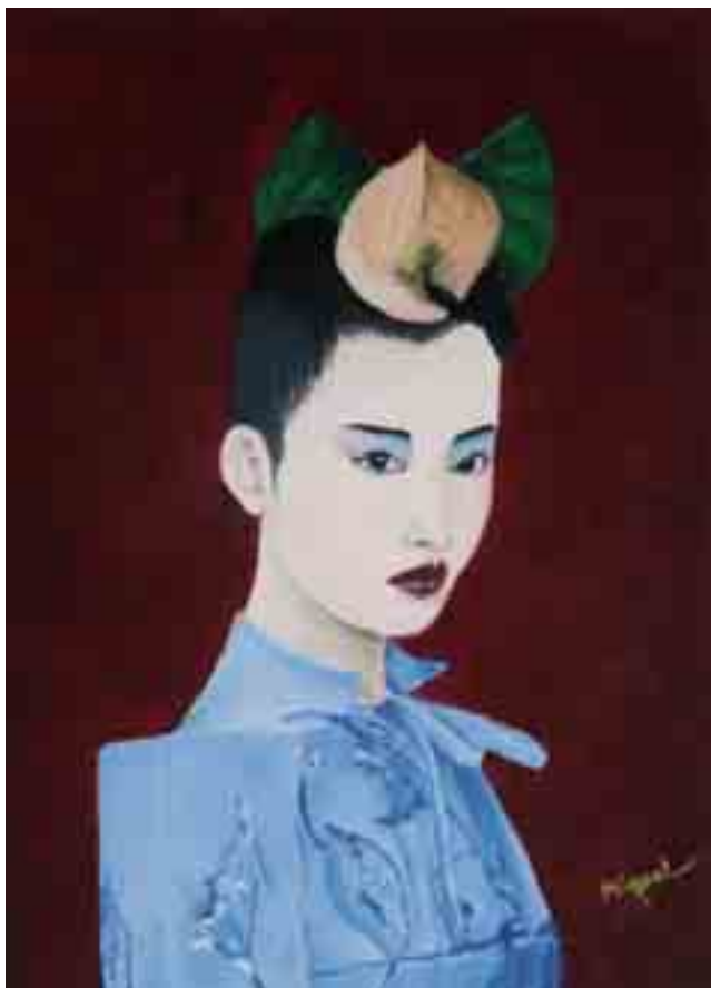
LA MÀSCARA DE L'ENGANY Miquel MASFERRER Oli s/tela