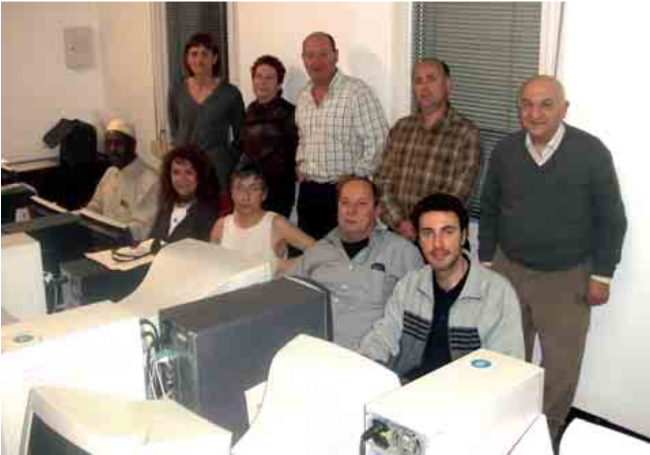
Alumnes d'alfabetització digital del curs actual

A mi m'agrada molt aquest curs. Al meu país la gent necessita cursos com aquest. Farem servir alguns programes i veurem moltes coses d'interès i, en general, les principals tasques que podem fer amb l'ordinador.