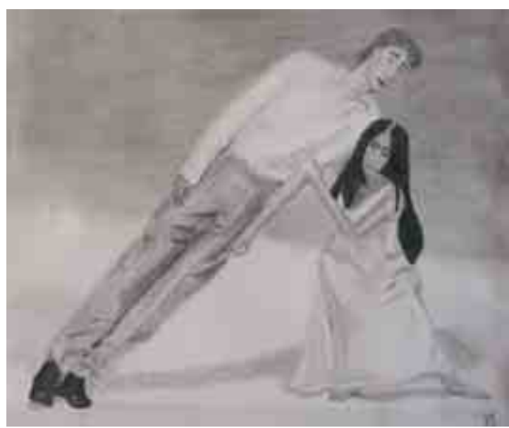
EQUILIBRI DESCOMPENSAT - Anna MONTORIOL - Llapis s/paper