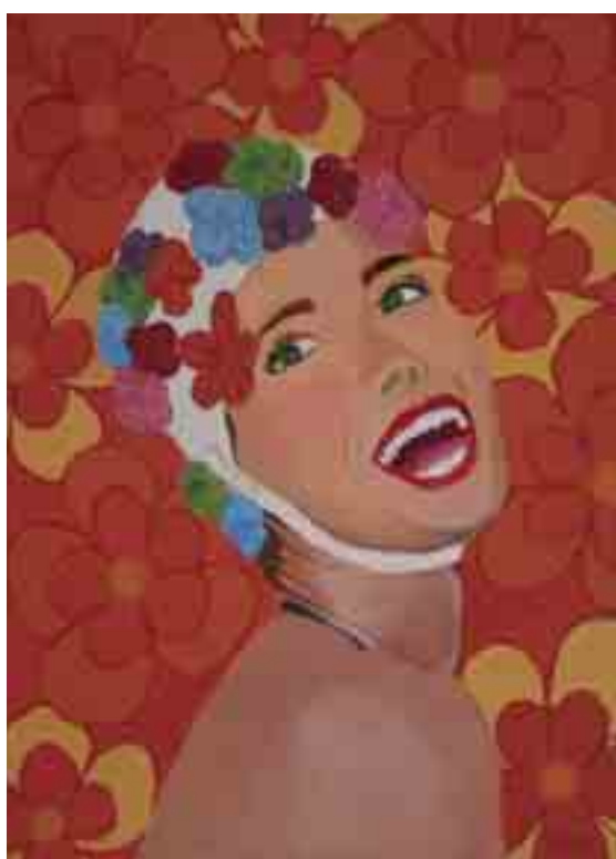
LA BANYISTA - Sílvia MERINO - Acrílic s/tela