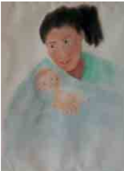
MARE I FILLA Salvador DEUMAL Pastel s/paper