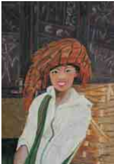
NOIA BIRMANA Maria CODERCH Acrílic s/tela