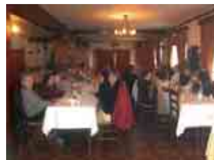
Dinar de celebració del Dia Internacional de les Dones, amb alumnes i professores del centre

Com ja ve sent tradició es va fer un dinar de celebració del Dia Internacional de les Dones en el qual van participar alumnes de diferents grups i professores del centre.