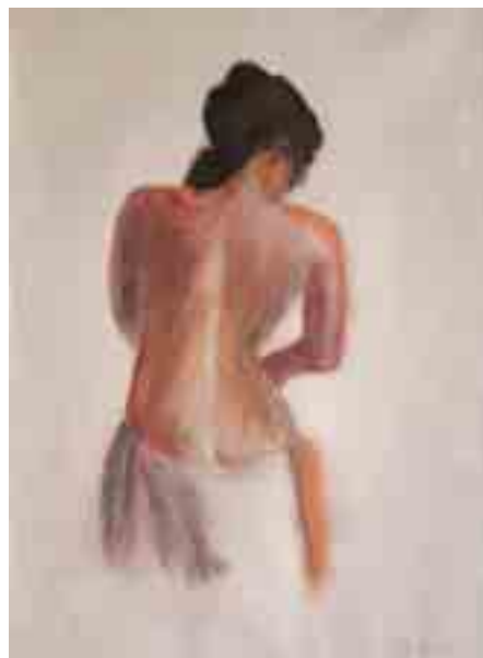
MODEL Salvador DEUMAL Pastel s/paper