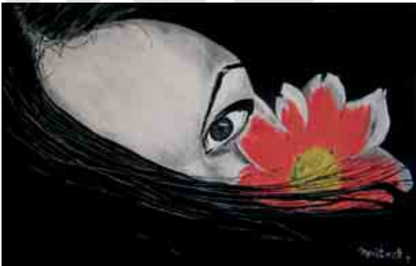
SENSUALITAT - Meritxell GARCÍA-MORENO - Acrílic s/tela