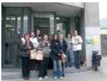
Alumnes de l'escola durant la seva visita a la Universitat Autònoma de Barcelona

sobre el pla d'estudis de la universitat. Posteriorment, van fer un recorregut en autobús pel campus i van visitar la Facultat de Ciències Econòmiques. Tots els assistents valoren molt positivament la visita.