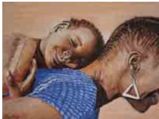
FEINA D'ESCARRÀS - M. Rosa MASUET - Oli s/tela