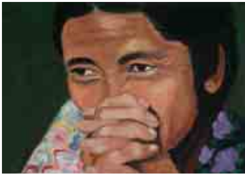
ESPERANÇA - Catalina ALONSO - Acrílic s/tela

Amb motiu dels actes de celebració del 8 de març, Dia Internacional de les dones, les i els alumnes de Dibuix i pintura hi han participat amb una exposició. La mostra presenta un conjunt de peces que tenen la dona com a eix central. Partint de temàtica "dona", han treballat a partir de fotografies trobades a l'atzar o volgudament buscades. Imatges escollides pel record, pel significat o senzillament per la seva bellesa. Com a resultat presentem un recull de retrats de dones d'arreu del món.