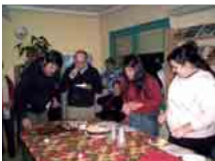
EL jurat del 16è Concurs de Pastissos i postres nadalencs tastant els dolços presentats