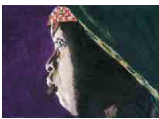
EL PENSAMENT - M. Teresa SALA - Oli s/tela