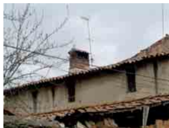
↑ Xemeneia a rehabilitar