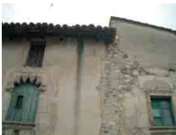
↑ Necessitat de reconstrucció de la canal de recollida d'aigües