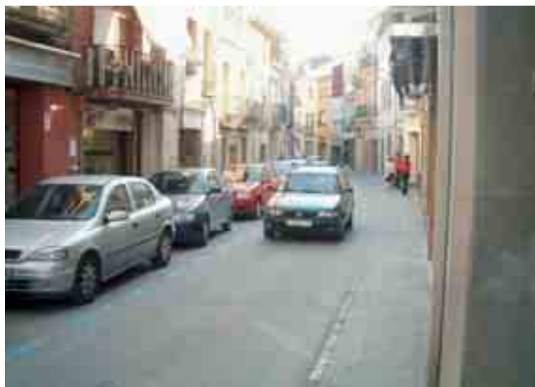
↑ Tram del carrer Major de Sant Celoni on es portarà a terme l'actuació

També està en fase de redacció el projecte d'urbanització del carrer de la Mosca, el qual definirà les obres de pavimentació dels carrers amb llamborda de pedra natural per afavorir-ne l'ús només per a vianants, la substitució de la xarxa existent de clavegueram, el pas de canalitzacions per encabir futures instal·lacions de telecomunicacions, l'adequació de la xarxa existent de subministrament d'aigua i electricitat i la nova instal·lació d'enllumenat públic.