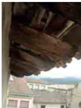
↑ Estat de degradació evident dels caps de bigues i llates

d'impermeabilització i aïllament. Es refaran les trobades amb parts massisses d'obra així com la xarxa de desguàs existent: amb peces iguals a les originals. La xemeneia, formada per rajolí ceràmic i coberta de teula, es rehabilitarà amb els mateixos materials originals