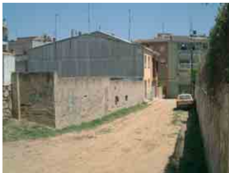
↑ Les obres d'urbanització dotaran de tots els serveis als carrers

Les obres d'urbanització dels carrers de l'Artesania i de l'Agricultura s'han adjudicat a l'empresa Formsace, SL. D'altra banda, arran d'una promoció privada també s'urbanitzarà un tram del carrer del Dos de Maig, inclosa la zona verda. Aquests carrers tindran un tractament de carrers per a vianants i no per a vehicles.