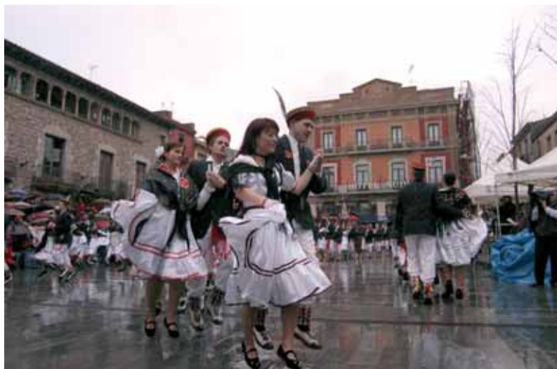
Ball de Gitanes de 2006.

Els personatges de la comparsa són el Capità de Cavalls que cavalca acompanyat dels seus cavallers, vestits elegantment de negre i tocats amb barret de copa. El Vell i la Vella són les autoritats de la Colla de Gitanes. El Vell és la personificació de l'Hivern i, de la Vella naixerà la nova estació: la Primavera. Els representen dues persones disfressades còmicament com els avis d'abans. El Vell porta boina, bastó i no li falta ni la botellola ni el caliquenyo. La Vella porta un mocador al cap, manteleta, davantal i faldilles llargues que no oculten el seu estat de bona esperança. Els diablots, grans i menuts, porten màscara amb banyes, roba vermella i una faixa negra d'on pegen els esquellots que amb el seu soroll invoquen els mals esperits. S'encarreguen d'esvalotar el públic durant la cercavila i de mantenir l'ordre a la plaça, on també fan befa d'algun aconeteixement que hagi passat durant l'any.