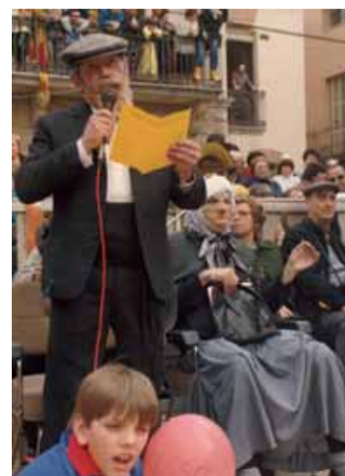
Ball de Gitanes de 1989. El Vell fent el discurs a plaça, acompanyat de la Vella.