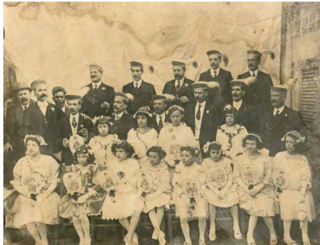
Ball de Gitanes de 1916. Colla de casats del Centre Popular (els casats ballaven amb nenes). Arxiu d'imatges de Sant Celoni

La roba dels balladors està inspirada en els vestits antics, coneguts per la documentació fotogràfica de començament de segle i testimonis orals. Els homes vesteixen pantalons i camisa blanca i americana negra. La faixa i el barret són vermells i aquest, està decorat amb una ploma. Als turmells hi porten camals amb picarols i cintes de colors. Les dones porten un vestit blanc curt i un mantó de Manila a l'esquena. Tant els balladors com les balladores toquen les castanyoles, fent dringar els picarols foragiten els mals esperits.