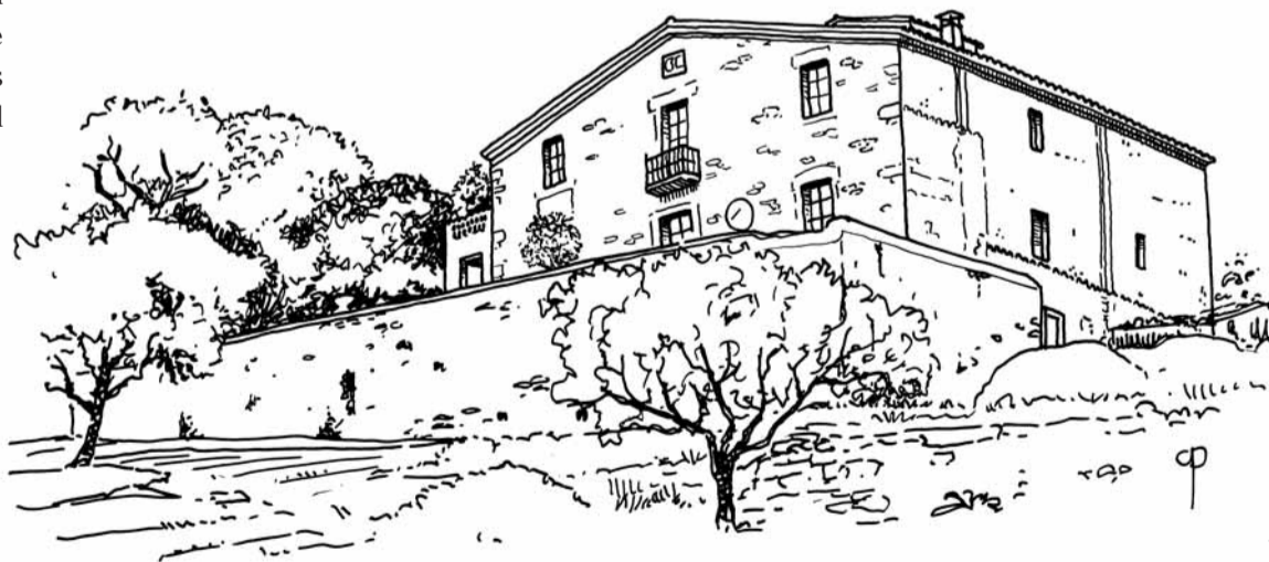
Can Draper (Vista des d'els horts) 2006