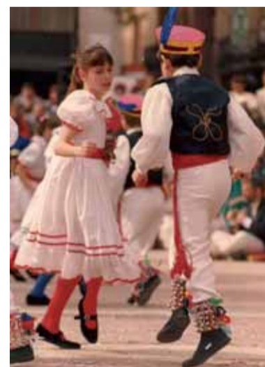
Ball de Gitanes de 1989.