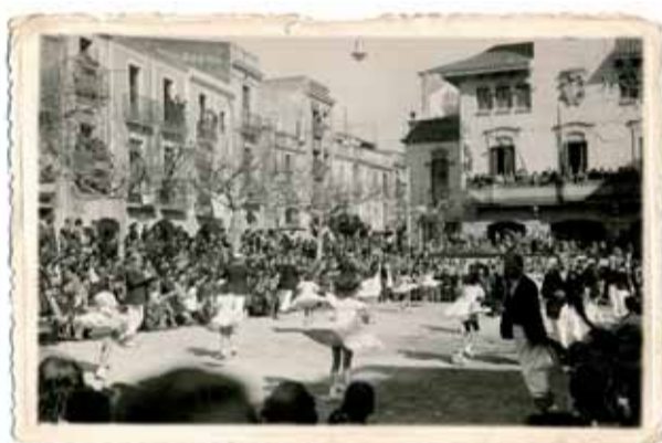
Ball de Gitanes de 1944. Colla de casats de l'Ateneu ballant el vals a la plaça de la Vila.

Al llarg dels anys el ball de Gitanes de Sant Celoni ha passat per diferents etapes i ha viscut llargs períodes d'interrupcions. El ball es va recuperar en els anys 50 i els 60 i, definitivament, el 1981. Des d'aleshores es tornen a ballar les gitanes a Sant Celoni els diumenges de Carnaval, acompanyades dels elements tradicionals de la festa: els diablots, el Vell i la Vella i el capità de cavalls.