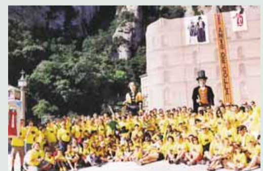
Arribada a la plaça del Monestir de Montserrat, diumenge 8 de juliol al migdia