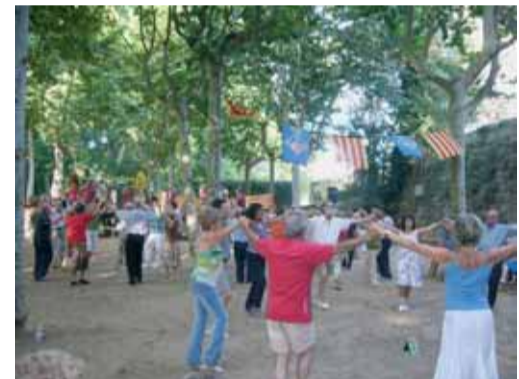
XLIII Aplec de la Sardana. juliol 2007