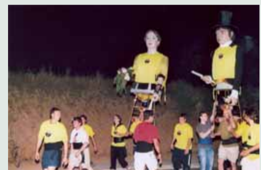
En Martí i la M. del Puig han anat a peu de Sant Celoni a Montserrat