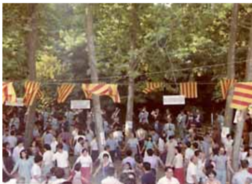
Aplec de la sardana. 1980

L'Agrupació Sardanista Baix Montseny de Sant Celoni va néixer fa 3 dècades per la il·lusió d'una colla d'amics de promocionar la cultura catalana. 30 anys després, continuen amb la mateixa voluntat i sense desistir de promocionar la dansa característica de Catalunya. Mostra d'això n'és el curset de sardanes a les escoles que des de fa 6 anys realitzen amb els escolars del municipi.