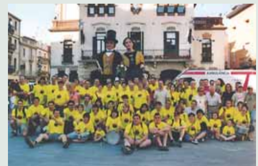
Sortida de la plaça de la Vila, divendres 6 de juliol a les 19.30 h