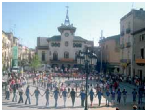
Cloenda del curset de sardanes a les escoles. Sant Jordi 2007