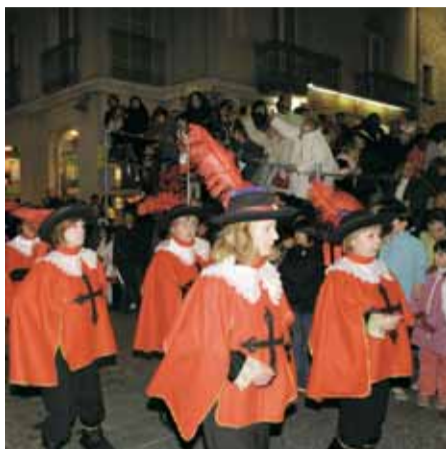
La mosqueteria amb 42 participants, va guanyar el premi a la comparsa més elaborada.