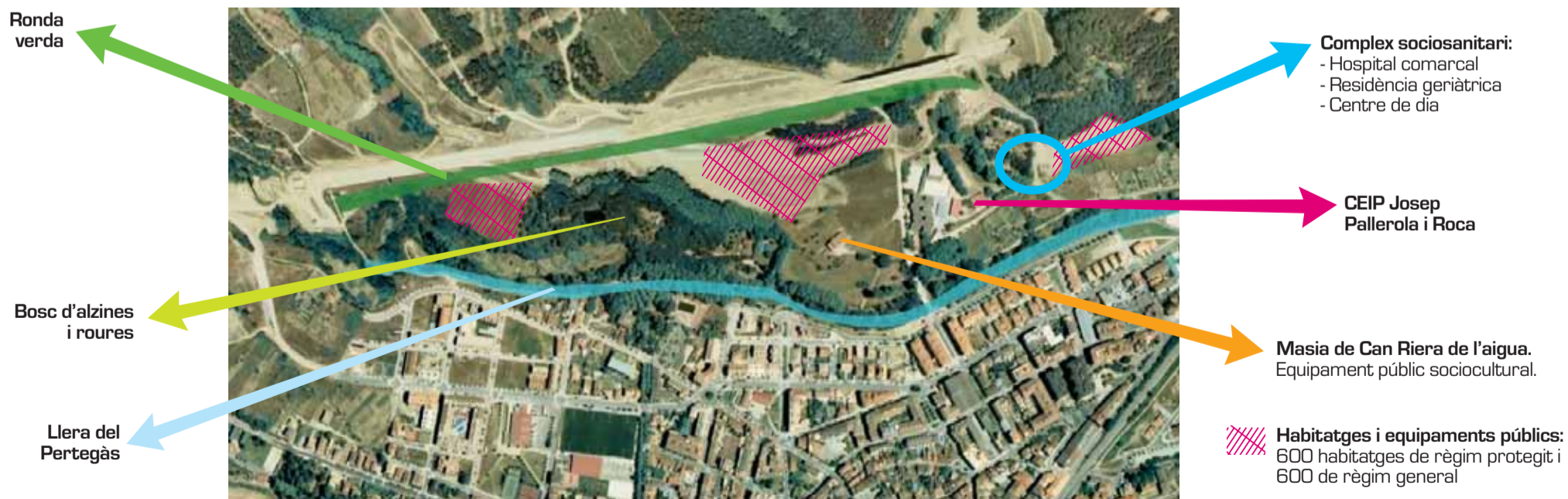
Simulació de la previsió de la zona

A causa de la demanda dels municipis, aquest pla ha doblat fins a 100 el nombre d'àrees que inicialment contemplava, que s'establiran a partir de la redacció de 12 plans directores urbanístics que s'aprovaran definitivament durant el primer trimestre de l'any vinent. A més de Sant Celoni, al Vallès Oriental s'hi ha inclòs la Roca, Cardedeu, la Llagosta, Parets, Granollers i Montmeló.