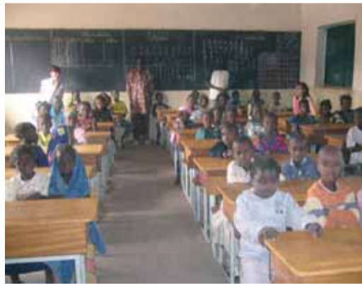
Jahali (Senegal). Escola