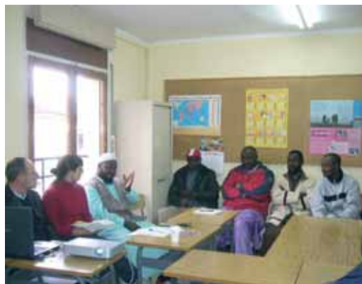
Valoració de la visita amb el GRIMM