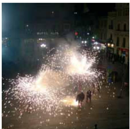
Els Diables amb el popular enterrament de la sardina van posar el punt i final al Carnaval.