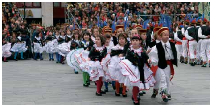
La plaça es va tornar a quedar petita, tot i l'ampliació de les grades, per seguir el Ball de Gitanes. Les 84 parelles de la Colla del Ferro i les 65 de la Colla del Filferro van oferir els balls típics de Carnestoltes com són: el galop d'entrada, el ball d'entrada, la jota, la contradansa, la polca, la farandola, la polca nova i el vals.