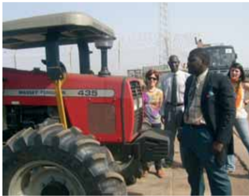
Jahali Madina (Gàmbia). Tractor