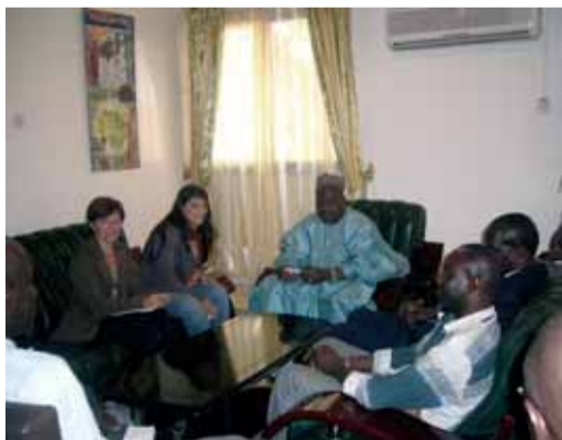
Ministre d'Agricultura de Gàmbia