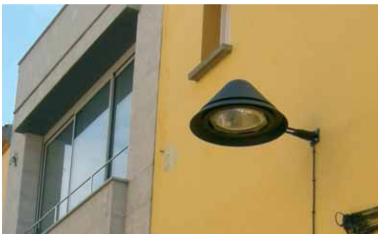
Nous punts de llum amb vapor de sodi d'alta pressió, nova tecnologia i amb el compliment de la normativa de seguretat i protecció lumínica vigent.