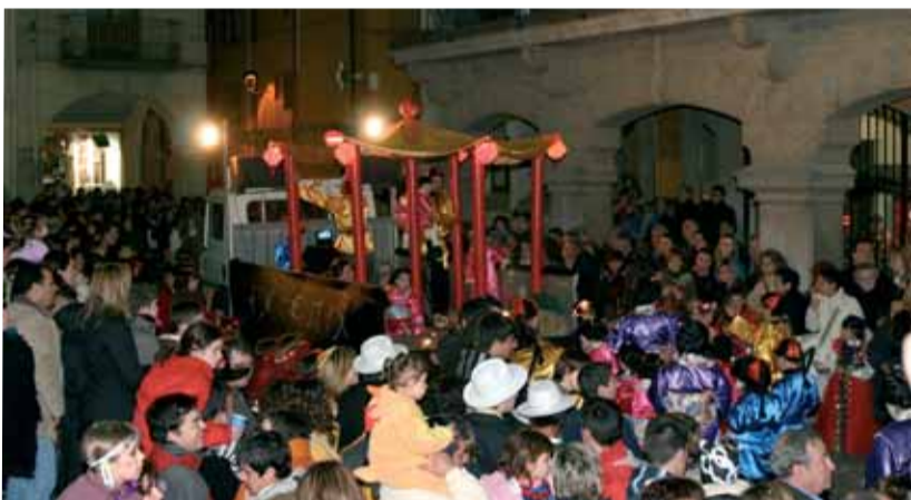
Un miler de persones, repartits en 16 comparses, van participar a la rua de Carnaval de Sant Celoni.