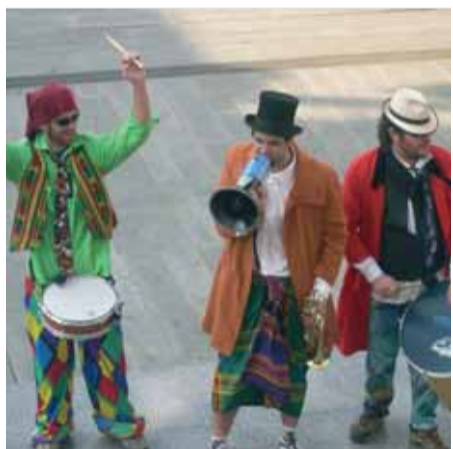
Els ajudants del Rei Carnestoltes van visitar les escoles i també la Casa de la Vila.