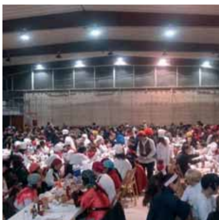
A causa de la gran afluència de gent el sopar popular es va haver de canviar d'ubicació i del Pavelló es va passar a la pista coberta. Durant el ball de disfresses, es van entregar els premis del XII concurs de comparses.