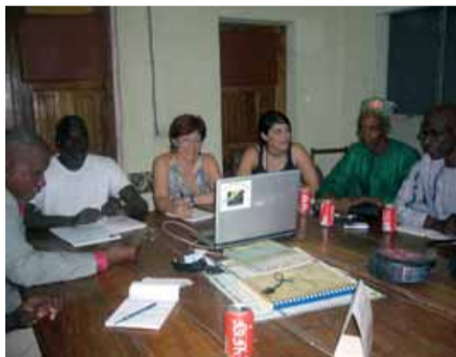
Reunió de balanç amb l'ONG FODDE

Sant Celoni sempre ha estat un poble solidari. L'elevada participació en esdeveniments col·lectius i de caràcter altruista constaten aquesta afirmació amb escreix i fan que el sentit de pertinença a la col·lectivitat sigui més profund i ompli d'orgull. L'Àrea de Comunitat, a través dels àmbits de Solidaritat i de Cooperació, porta a la motxilla un bon grapat d'anys de treball en aquesta direcció. Un treball que sense cap dubte repercuteix significativament en el progrés del municipi, tant pel que fa a la consciència activa d'un món amb desigualtats i injustícies, com pel que fa a la bona convivència entre autòctons i nousvinguts. Dos temes incipients que es convertiran en oportunitats per aquells que els afrontin amb valentia i generositat. I, en canvi, es convertiran en problemes per aquells que hi aboquin por i ignorància. A aquest ritme, però, Sant Celoni haurà superat el repte abans de mitjanit. I tots hi sortirem guanyant!