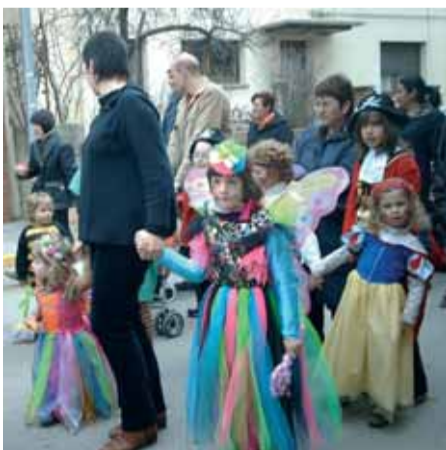
A la Batllòria, la rua de Carnaval va aplegar un nombrós públic.