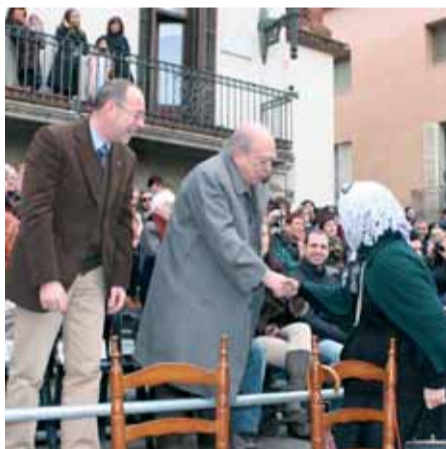
El convidat d'honor d'aquest any va ser l'expresident de la Generalitat de Catalunya, Jordi Pujol, que es va integrar plenament a la festa ballant, fins i tot, la part final.