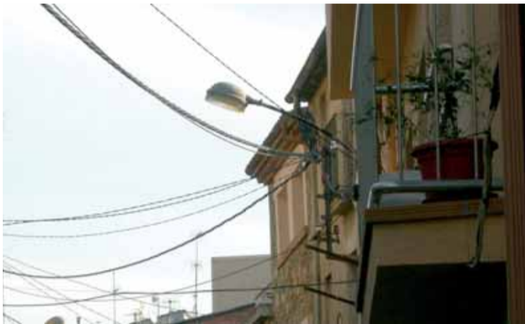
Punts de llum de mercuri, tipus bàcul, que se substituiran per adaptar-se a la normativa vigent.

Aquestes millores també arribaran a més carrers: Properament es remodelarà la xarxa d'enllumenat exterior dels carrers: Sant Josep, des del carrer de Sant Martí fins al carrer Major, carrer de Callao, de Sant Joan, de Sant Jordi i carrer de Sant Antoni. En una segona actuació es farà els carrers de Pau Casals, de Joaquim Sagnier, d'Esteve Mogas i de Santiago Rusiñol.