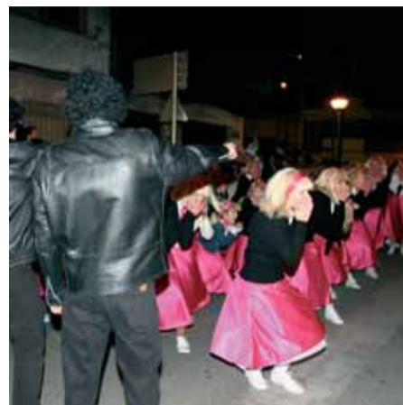
La més animada va ser la comparsa Grease 1 amb 64 components.