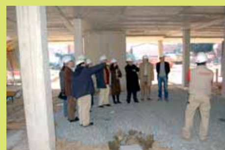
Darrera visita d'obres per part de l'alcalde i els regidors de l'Equip de Govern