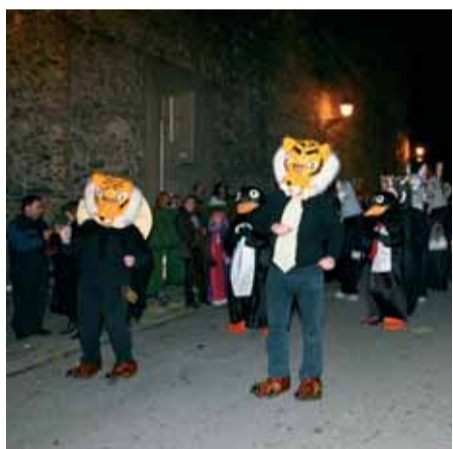
El guardó a la més original el va aconseguir la comparsa disfressada d' Arca de Noè amb 70 persones.