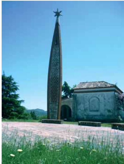
L'ermita i l'obelisc del Turó del Puig o de Bellver

Expliquen les edificacions més antigues que el poble de Sant Celoni va créixer a la vora de l'ermita de Sant Martí de Pertegàs, on la proximitat a la riera, a l'aigua (font de vida) i als sòls fèrtils de les terrasses al·luvials facilitaven l'esperit humà el recer amb la Mare Terra. Tanmateix, els punts elevats del terreny també són punts de referència en el coneixement del nostre entorn i en el creixement del nostre esperit, i per això és fàcil imaginar com d'important podia haver estat el Turó de la Mare de Déu del Puig per als primers pobladors de Sant Celoni : zona de guaita als quatre vents, lloc estratègic per divisar amics i enemics i lloc privilegiat per reconèixer el relleu de l'entorn i les forces de la natura.