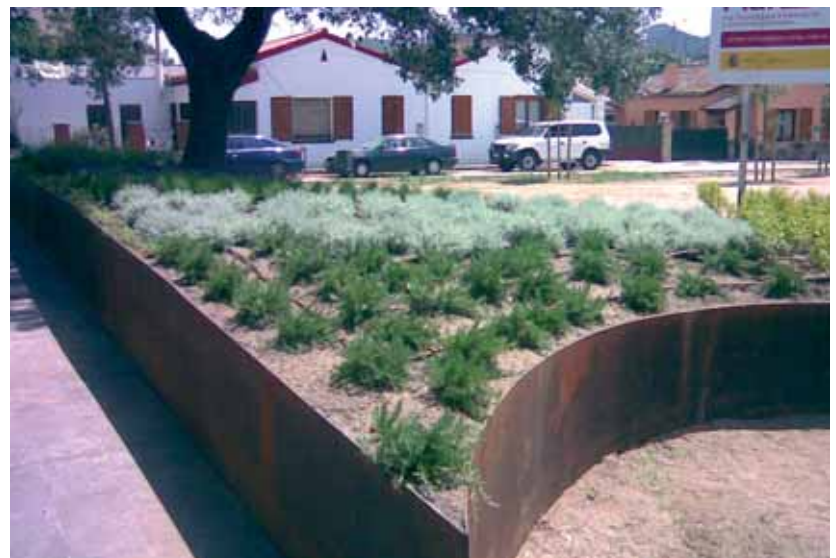
D'aquí a uns dies s'instal·laran els jocs infantils i que s'han retirat de la plaça Baix Montseny

La plaça Colònia Pla de Palau ha estrenat nou enjardinament, vorals i arbrat, dins les actuacions subvencionades pel Fons Estatal d'Inversió Local. D'aquí a uns dies s'hi instal·laran els jocs infantils que s'han retirat de la plaça Baix Montseny, arran de la construcció del nou centre de formació permanent.