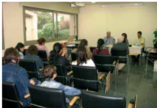
Llinars del Vallès