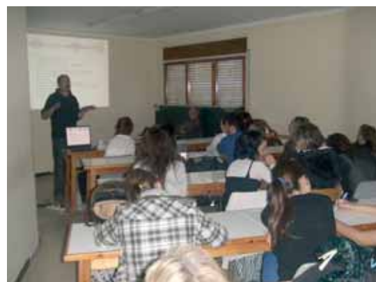
Els professors de l'IES van presentar els cicles de gestió administrativa i instal·lació i manteniment als alumnes de l'Escola d'Adults

El 28 d'abril es va realitzar una xerrada informativa, organitzada per l'IES Baix Montseny, adreçada a l'alumnat que es prepara per a la prova d'accés a cicles formatius de grau mitjà del Centre de Formació d'Adults Baix Montseny. El professorat de l'IES va fer una introducció sobre els estudis de formació professional i seguidament va informar sobre la durada, els objectius i el perfil professional dels dos cicles formatius de grau mitjà que ofereix l'institut: gestió administrativa i instal·lació i manteniment. Durant aquest curs, l'Escola d'adults ha preparat un total de 94 persones per accedir a la formació professional, 38 per a cicles formatius de grau mitjà i 56 per a cicles formatius de grau superior.