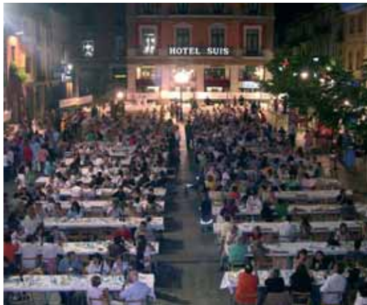
La plaça de la Vila serà l'escenari de la 3a Mostra de Cuina del Baix Montseny

Els restaurants i pastisseries del territori oferiran les seves creacions que podreu apreciar el divendres 26 de juny, a partir de les 9 del vespre, a la plaça de la Vila. El preu del tiquet, que es pot adquirir a diversos establiments de Sant Celoni, és de 13 euros i inclou tres plats, unes postres, beguda i cafè.