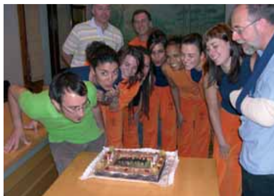
Tots els membres de l'equip van compartir un pastís commemoratiu