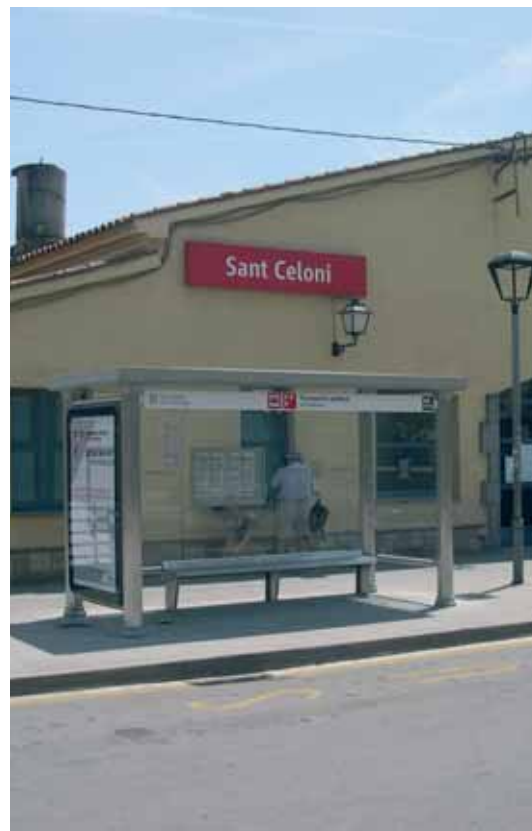
L'estació, Molí Paperer i la Batllòria són les tres parades que han estrenat marquesina

Durant el mes de maig s'han instal·lat 3 noves marquesines de bus per part de la Generalitat de Catalunya. Els punts concrets són: Estació de tren; Molí Paperer (vial paral·lel nord de la C35 amb carrer d'Indústria) i la Batllòria (carrer de les escoles amb la Placeta).