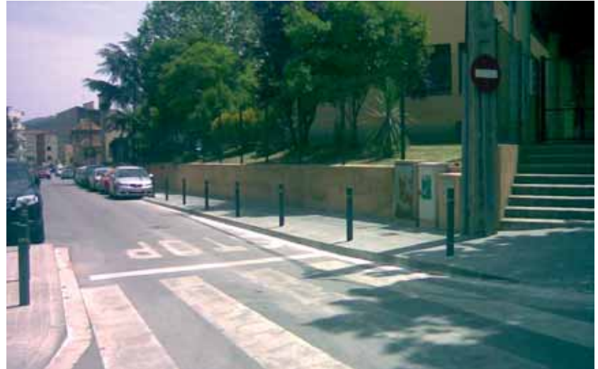
Cruïlla del carrer de Ramis amb Passeig dels Esports

Per millorar la mobilitat a peu pels carrers de la vila, fa uns dies s'ha renovat la vorera del carrer de Palautordera, entre els carrers Vallès i Doctor Barri, i s'ha millorat la cruïlla del carrer de Ramis amb Passeig dels Esports. Dins la campanya de millores continuades durant el 2009, properament s'intervindrà la vorera del carrer de Diputació (entre Avinguda de la Pau i Ramon y Cajal) i la vorera del carrer de Germà Emilià (entre Campins i Major).