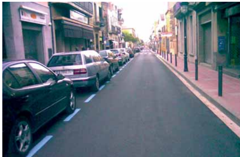
S'ha reasfaltat el tram de la carretera Vella que va del carrer Major fins Anselm Clavé

A finals de maig s'ha dut a terme el reasfaltat de la carretera Vella en el tram comprès entre el carrer Major i Anselm Clavé. Per estalviar desgavells en el trànsit les obres es van escurçar al màxim i van començar dimecres 20 a la tarda i van acabar dissabte al migdia, una dia abans del previst inicialment gràcies a l'esforç de l'empresa contractada i al civisme de la ciutadania.