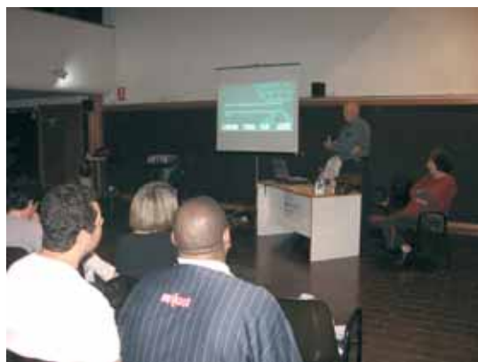
Sant Maria de Palautordera