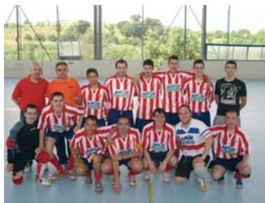
L'equip ha acabat la temporada a la categoria de Preferent, assolida l'any passat, amb una meritòria segona posició

Per altra banda, l'equip ha aconseguit arribar fins a quarts de final de la Copa Catalunya, on va caure davant del Fusal Mataró. En aquesta competició hi juguen equips de la màxima categoria catalana, com ara el FC Barcelona.