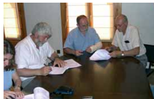
La signatura va tenir lloc a la Sala de Plens de l'ajuntament de Sant Celoni en presència dels tres alcaldes

La seu central és l'Oficina Local d'Habitatge situada al Safareig i es creen 2 nous punts d'informació als municipis amb més població del territori: Santa Maria de Palautordera i Llinars del Vallès, que han de permetre un major nombre d'atencions i menys esperes durant els períodes de convocatòries.