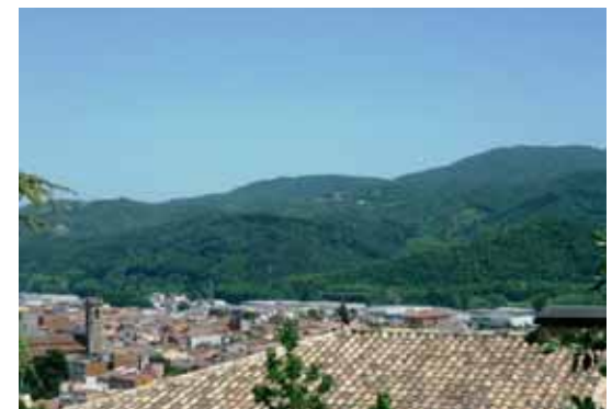
El nucli urbà de Sant Celoni amb el sot de Bocs i el Montnegre al fons

Girem una mica més, de cara al sud-oest, i veurem com s'obre la plana del Vallès, un paisatge amansit, amb un horitzó pràcticament planer que fa de partió de conquestes, la de la Tordera on som ara, i la del Mogent, que s'emporta les aigües cap al Besòs fins a Barcelona.