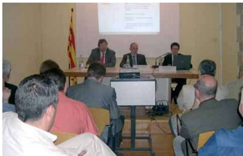
A la Rectoria Vella va tenir lloc la presentació tècnica de les millores