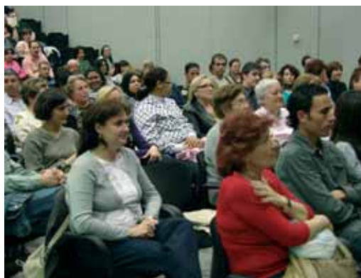
Presentació del Quadern realitzat pels alumnes de català centrat en l'escriptora Mercè Rodoreda