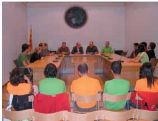
L'expedició d'Alta Muntanya, que estava formada per 13 persones del Baix Montseny i l'Alt Ma-resme d'entre 28 i 50 anys

L'ajuntament de Sant Celoni va organitzar el passat 18 de setembre un acte de recepció als expedicionaris del CESC que aquest estiu van fer el cim del Tocllaraju, al Perú. Durant la trobada l'alcalde Francesc Deulofeu va felicitar novament als excursionistes per la nova gesta assolida i va reiterar "l'enhorabona i l'agraïment a l'entitat per la tasca social i esportiva que ofereixen al municipi des de fa 25 anys".