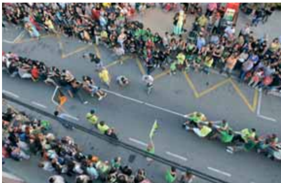
Els petits i les dones de la Colla dels Negres es van endur el punt de l'estirada de corda. Els homes Senys la van estirar més fort!!