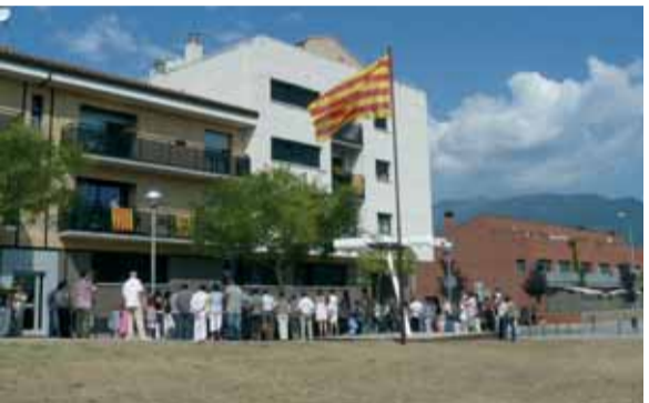
El passeig de l'Onze de setembre va acollir un any més l'acte institucional amb motiu de la Diada. Es va llegir un manifest unitari, diverses entitats van fer ofrenes florals i acompanyats per la Coral Briançó i la Cobla Tres Vents es va cantar el Cant dels Segadors. La senyera oneja de manera fixa al costat del monument des de l'11 de setembre d'enguany.