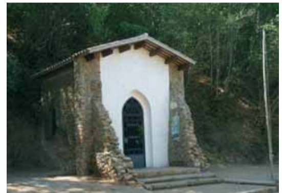
La reixa de ferro és l'original, data de 1888

La capella de Santa Maria era un edifici molt senzill de planta rectangular, construït el 1888 pels propietaris de can Preses, que és l'indret on es troba l'ermita. Com molts edificis de finals del segle XIX utilitza elements de tradició gòtica, que aleshores estava de moda, però fets amb maó. Hi ha els arcs apuntats de la porta i les dues finestres interiors, o la volta de maó aguantada sobre capitells ceràmics, dels quals es conserven algunes restes. L'ermita encara estava dreta a finals dels anys cinquanta, com consta en fotografies de l'època. Era un referent de la zona i un punt de destí i trobada de molts excursionistes, especialment pels procedents de la zona de marina. L'edifici, situat a uns quatre quilòmetres de Sant Martí de Montnegre, es troba davant d'un arbre monumental, el roure centenari de Santa Maria i al costat d'una font que té el mateix nom.