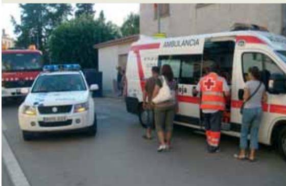
Divendres a la tarda les sirenes no van deixar de sonar! Eren els nens i nenes de la vila que gaudi- en dalt dels vehicles de servei.

La Batllòria va viure els dies 21, 22 i 23 d'agost la seva Festa Major d'estiu amb una gran participació ciutadana a tots els actes programats