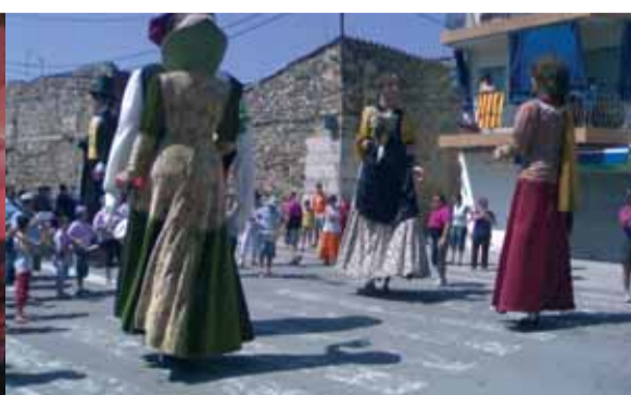
Un altre cop els veïns i veïnes de la Batllòria van donar la benvinguda als gegants vinguts d'arreu.