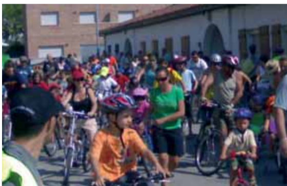
El dia va acompanyar als participants de la Bici- cletada, grans i petits tos van pedalar pels car- rers de la Batllòria.