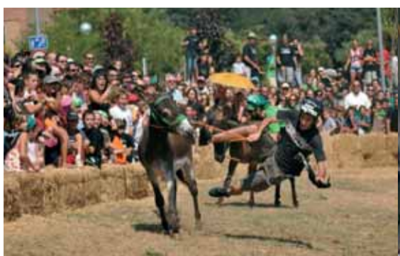
12 curses de rucs, cada 4 curses val un punt... ... Negres 2 - Senys 1!