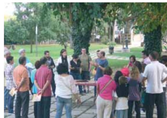
Un centenar de persones van visitar el Sant Celoni medieval

La torre de la Força, situada al carrer de les Valls, està oberta al públic tots els dissabtes a la tarda, i els diumenges i festius durant tot el dia.