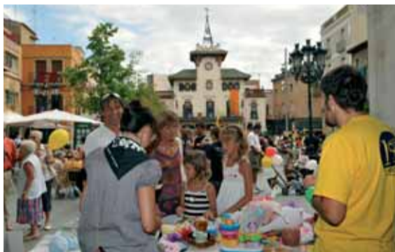
Èxit d'intercanvi de jocs i llibres a la plaça de la Vila.