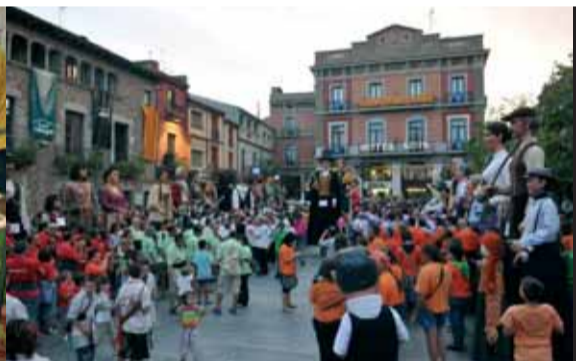
Els carrers i les places es van omplir de gom a gom amb el cercavila de gegants vinguts d'arreu... fins i tot de França.