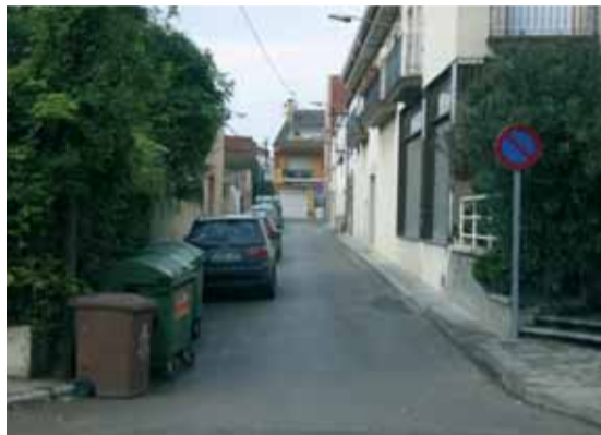
Passatge Lleida abans de l'actuació de millora que es va consensuar amb els veïns i veïnes.

Durant el mes de setembre s'han reprès els treballs de millora de l'accessibilitat. En concret, s'està actuant a diversos punts de la Batllòria: carrer Major amb carrer Breda, carrer Major amb Carretera Vella i carrer Riells amb carretera Vella. Pel que fa a Sant Celoni, s'ha començat a diverses cruïlles del carrer de Diputació i es continuarà amb la vorera –molt malmesa– d'aquest mateix carrer, entre Ramon y Cajal i avinguda de la Pau. Per l'octubre serà el torn del carrer d'Alguersuari, entre Carretera Vella i plaça de l'Estació, un àmbit especialment interessant per l'elevat nombre de persones que hi circulen.