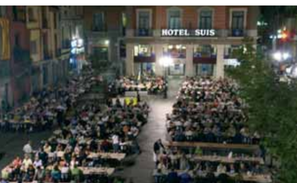
1200 persones es van llepar els dits al sopar popular amb el xai amb pa amb tomàquet que van preparar la Colla Geganter.