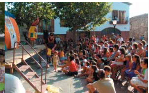
La plaça de l'església es va anar omplint en mica en mica. Tots a veure els de Trup de Nassos que tornaven del Líban!