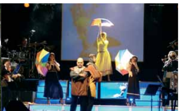
A l'Ateneu, concert i ball de Festa Major amb l'Orquestra Volcán