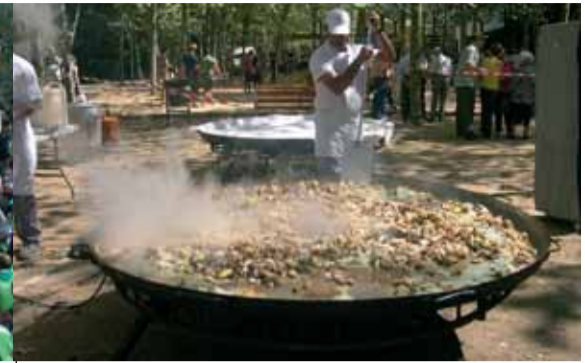
Al parc de la Rectoria Vella... arròs per a tothom! Es van servir més de 800 plats d'arròs!