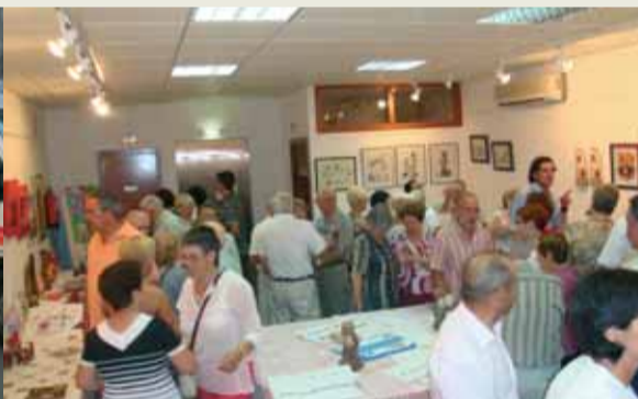
Gran èxit de participació i d'assistència a la inau- guració de l'exposició, on els diferents artistes de la Batllòria han exposat els seus treballs.