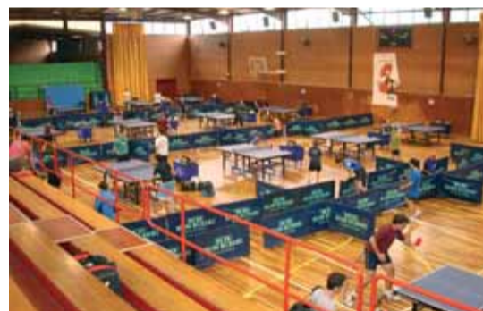
El club ja ha començat els entrenaments de l'escola de nens i nenes i dels federats

80 esportistes, 50 federats i 30 aficionats, dividits en 5 categories diferents, van participar el passat 13 de setembre al Pavelló d'esports al X Torneig tennis taula, organitzat pel Club Amics Tennis Taula Sant Celoni. El Club ja ha començat els entrenaments: l'escola de nens i nenes els dimarts i dijous de 18.30 a 20 h i els federats, els dilluns i dimecres de 19 a 20.30 h. Les persones interessades es poden dirigir al Pavelló d'Esports o enviar un correu a cattsantceloni@gmail.com