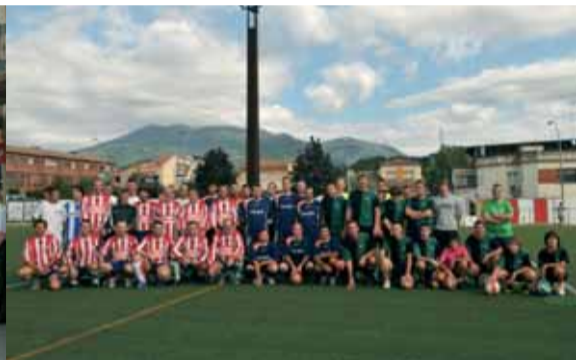
Com cada any geganters, policies locals, mossos, regidors i personal de l'ajuntament es van veure les cares al tradicional partit de futbol. Els guanyadors, els regidors i treballadors municipals.