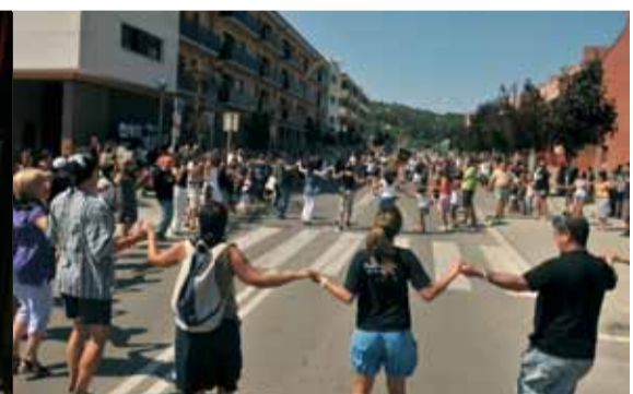
A la sardana puntuable, els Negres es van endur el punt.