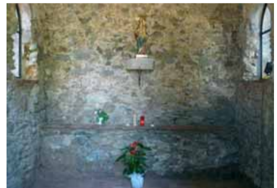
La talla barroca és una rèplica de la imatge de Santa Maria de Montnegre