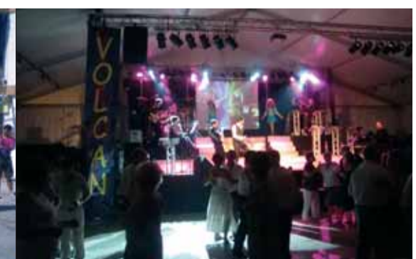
L'orquestra Volcan va tornar a lluir, concert i ball seguit. Vilatans i foranis es troben i gaudeixen dels clàssics dels balls de saló.