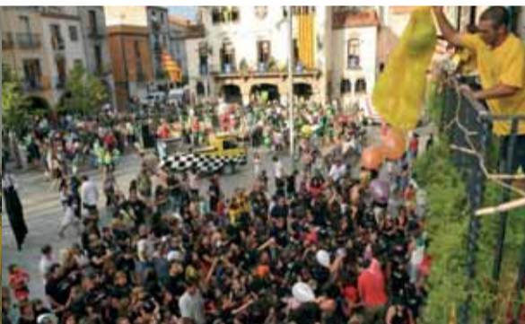
La gent de l'AE Erol van fer moure grans i petits pels carrers de la vila amb el Correxutxes. El punt? Pels Senys més petits.