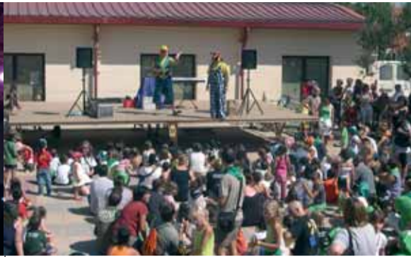
L'últim dia de festa... a la plaça de la Biblioteca els més petits van ballar i saltar amb La Companyia.