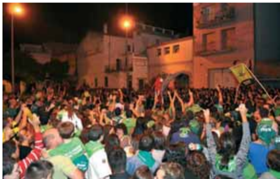
En Pep Callau, els Xarop de Canya i més de 800 persones... música, festa, aigua i globus al Correxarrups 2009.