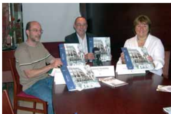
Presentació del volum que recollirà més de 1200 fotografies en 54 fascicles