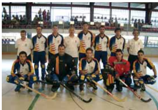
La Selecció catalana es va imposar davant el primer equip celoní i al GEiEG

El tradicional torneig d'inici de temporada organitzat per la secció d'hoquei del Club Patí Sant Celoni va comptar el darrer cap de setmana d'agost amb la presència de la Selecció catalana absoluta que es va imposar davant el primer equip celoní i el GEiEG de Girona. Les categories de prebenjamí, benjamí, aleví i infantil del CP Sant Celoni van competir contra el CP Breda, CP Maristes Sant Joan i CP Congrés.