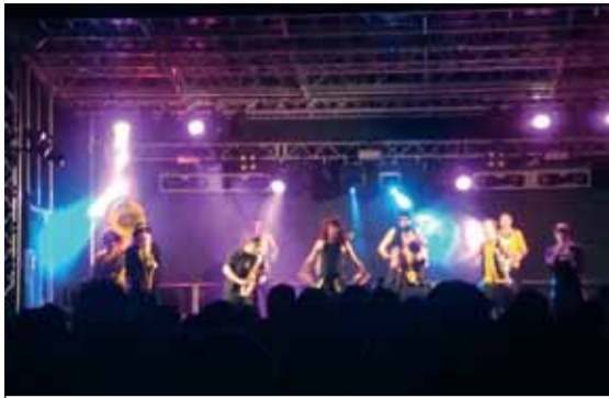
I a l'escenari de barraques... els Always Drinking Marching Band van tancar les nits de festa. L'any vinent... més!