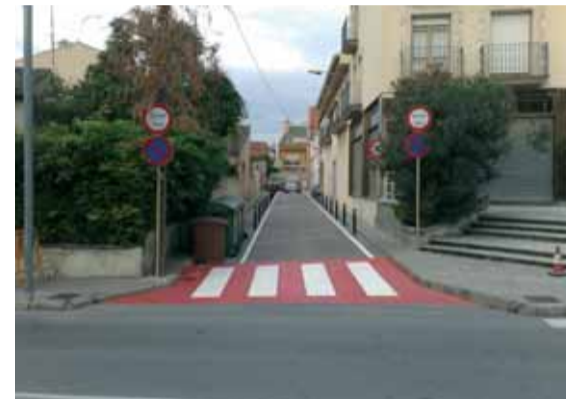
Aspecte actual del carrer amb dos passos de vianants als extrems, prohibició d'estacionament a les dues bandes i limitació de la velocitat a 30 km/h