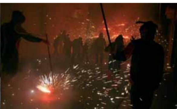
La colla de diables de Sant Celoni va cremar per tot el poble.