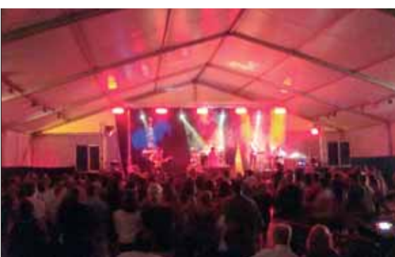
Després de l'èxit del sopar popular, tots a ballar a l'envelat, al ritme dels hits dels 80 i els 90... Ple fins la bandera.