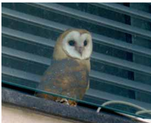
L'òliba que es va quedar atrapada a la finestra del carrer Major

Així doncs, si mai trobeu un niu no les molesteu, i si en trobeu alguna de ferida o en perill podeu avisar a l'ajuntament de Sant Celoni o portar-la al Centre de Recuperació de Fauna Salvatge de la Generalitat de Catalunya, a Torreferrussa.