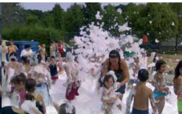
I després de la Bicicletada a ballar i xalar amb la festa de l'escuma.