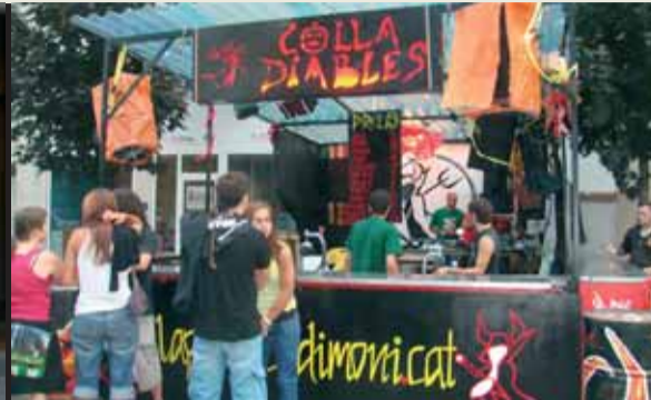
A barraques... festa, música i bon rotllo cada dia al vespre i fins la matinada.