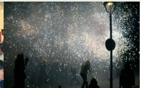
Els carrers de la vila han vist com el jovent feia suar de valent als Diablers de Sant Celoni. Gran ambient de correfoc !