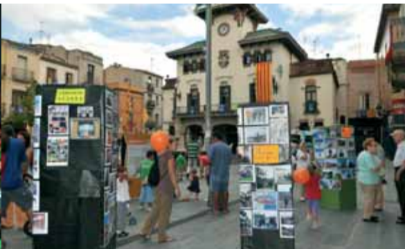
A la prova Senys i Negres pel món la cosa va acabar força igualada: 2 punts pels Senys i 1 pels Negres.