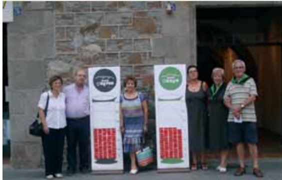
Senys i Negres donen sang per a la Festa!! 1/2 punt per a cada Colla... el Corremonts va començar ajustadet.

Per segon any consecutiu, els Negres van guanyar el Corremonts amb 9,5 punts davant els Senys amb 8,5. Durant els 4 dies de festa, el poble es va tenyir de verd i negre i hi va haver molta participació a tots els actes programats