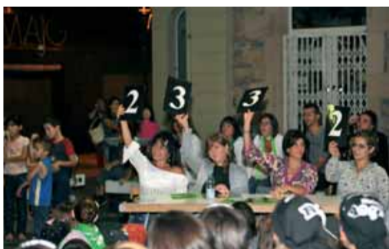
Una plaça de la Vila ben plena de gent, va ser l'escenari on la Colla dels Senys es va endur el punt del Trepitja la pista.