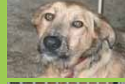
Nom: POLO Gènere: Mascle Raça: Mestis Edat: Adult