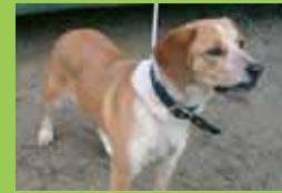
Nom: BLAY Gènere: Mascle Raça: Mestis Edat: Adult