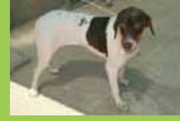
Nom: XISPA Gènere: Femella Raça: Mestissa Edat: Jove