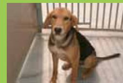
Nom: KOKO Gènere: Mascle Raça: Mestis Edat: Adult