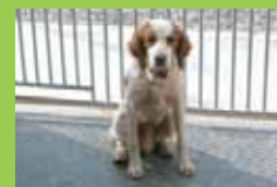
Nom: SEBI Gènere: Mascle Raça: Esp. Bretón Edat: Adult

Si hi teniu interès adreceu-vos a l'Àrea d'Espai públic (Tel. 93 864 12 16, c/ Bruc, 26 de 8 a 15 h o a la Masia Can Clarens de Vallgorguina (Tel. 600 585 990, 93 707 44 12).