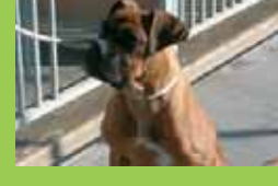
Nom: DAMA Gènere: Femella Raça: Boxer Edat: Jove