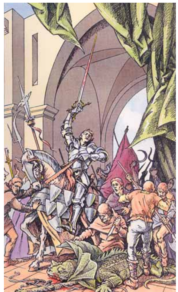
Soler de Vilardell entra victoriós a la vila de Sant Celoni després de matar el drac. Pintura de Marià Vigas.