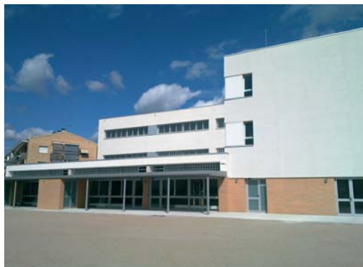
El nou edifici té una superfície construïda de més de 3.400 m 2

Durant l'estiu el Departament d'Educació de la Generalitat de Catalunya s'emportarà els mòduls prefabricats i traurà els fonaments dels mòduls perquè el pati d'educació primària compleixi les condicions adequades. Un cop realitzada aquesta tasca es construiran les pistes poliesportives al costat del pati d'educació primària.