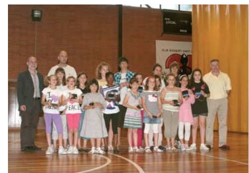
Club Bàsquet Sant Celoni, equip Premini femení. Campiones de lliga (nivell C)