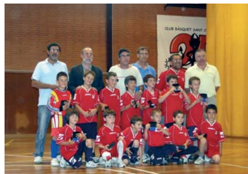
Penya Barcelonista Sant Celoni, equip Prebenjamí C. Campions de lliga