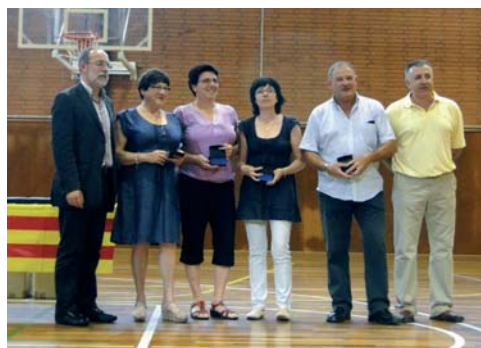
Club Arc Sant Celoni, equip femení d'Arc compost. Subcampiones d'Espanya per equips i classificades per la final a quatre d'enguany