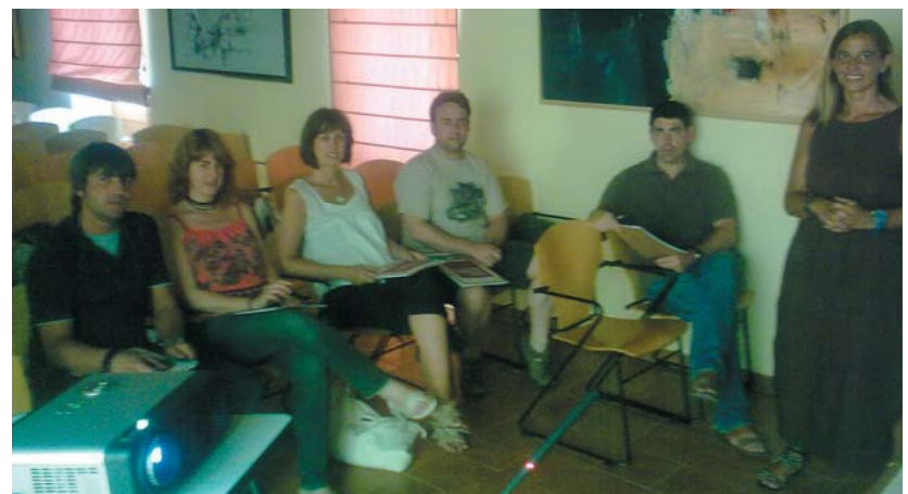
Imatge de la jornada de formació per a comerciants

D'altra banda, Sant Celoni Comerç té previst organitzar el proper 17 de juliol una nova edició de Rebaixes al Carrer que aquest any comptarà amb la novetat de realitzar-se també de nit, de 17 h a 24 h amb activitats pròpies de les nits estivals. A més, fins el 22 de juliol continuarà repartint "Vilanas" de la Pastisseria Vila als titulars de la targeta Sant Celoni Comerç, que també podran aconseguir un pack de degustació de 4 cerveses de la Cia. Cervesera Montseny durant la primera quinzena de juliol.