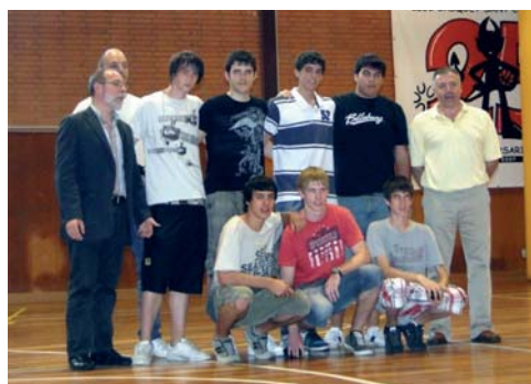
Club Bàsquet Sant Celoni, equip Júnior masculí. Subcampions de lliga (nivell B) i semifinalistes del campionat territorial de Barcelona