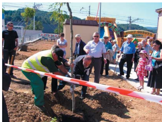
Plantació d'arbres a la inauguració

Després de molts anys d'espera, Sant Celoni disposa d'una entrada digne per la Porta de Ponent. L'actuació amb un pressupost de 3,2 milions d'euros, ha permès afavorir l'accessibilitat en aquest entorn, així com la seguretat i fluïdesa del trànsit. Dissabte 5 de juny va tenir lloc la inauguració oficial amb una festa popular al carrer Doctor Barri, amb música i jocs infantils. Durant l'acte, els veïns van participar en la plantació d'alguns arbres per acabar d'embellir-ne l'entorn entre tots. Uns dies abans, l'alcalde Francesc Deulofeu i el secretari per a la Mobilitat de la Generalitat, Manel Nadal acompanyats de regidors i tècnics municipals i mitjans de comunicació, van fer una visita a les obres. Segons l'alcalde “s'ha resolt un dèficit històric del municipi, amb una solució funcional i alhora estètica que ha recollit l'aportació que s'ha fet des de l'ajuntament incorporant, per exemple, els accessos per a vianants” .