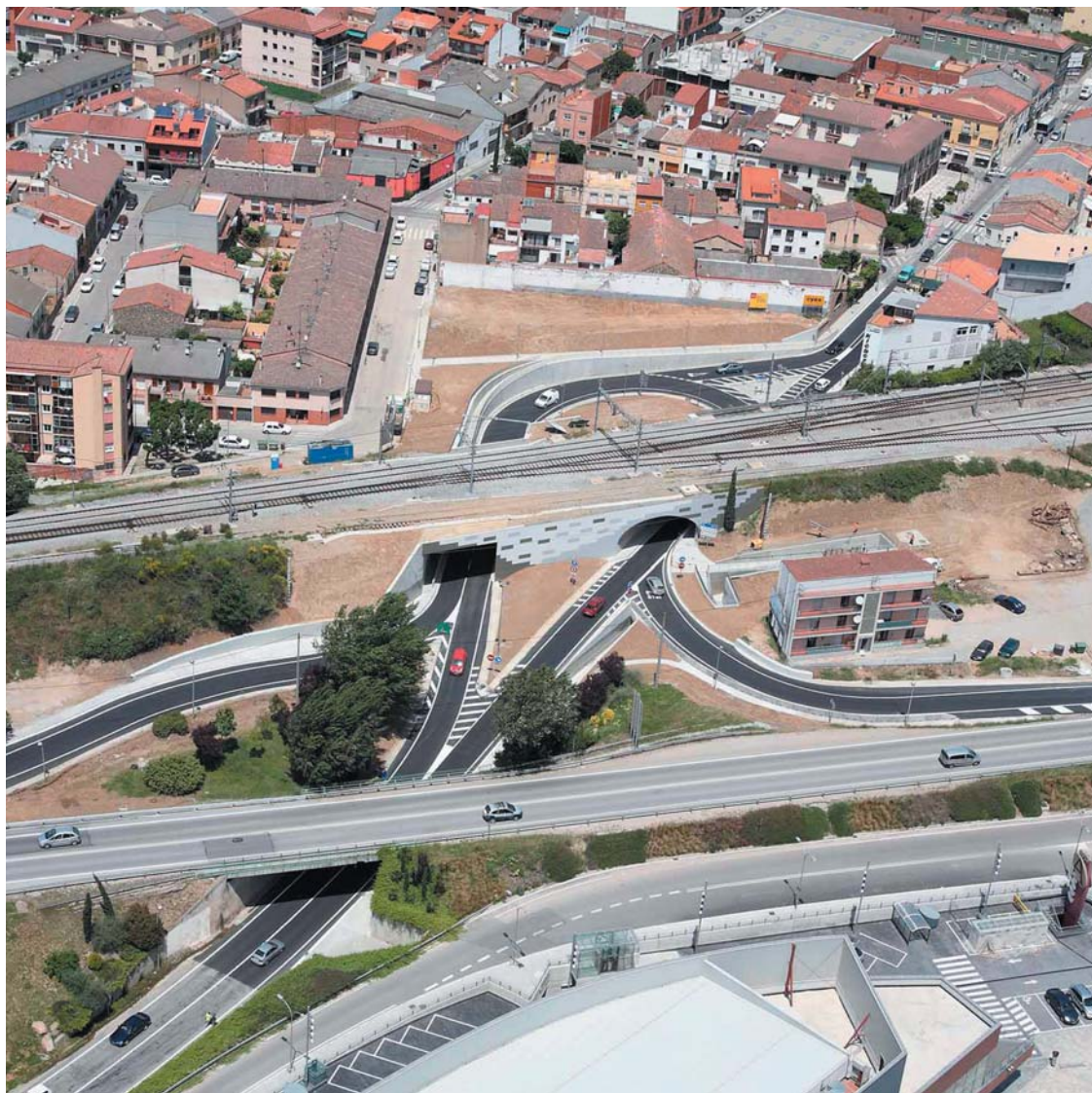
Vista aèria de l'entrada al municipi per ponent