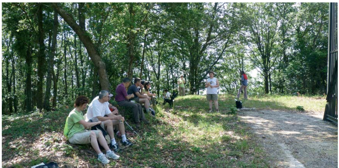
Una vintena de persones van gaudir de les boscúries montnegrines

Preses i bolets com el pixacà i algun sureny! L'esplendor primaveral de la roureda va sorprendre a més d'un que no esperava trobar un bosc caducifoli d'aspecte centreeuropeu tan a prop del mar. Es compararen les fulles del roure africà i les del roure de fulla gran, s'identificaren cirerers, avellaners i trèmols, i es va gaudir de l'observació de les belles flors de la valeriana, la campaneta blava i el corniol. Ja davallant es va topar amb el roure de Santa Maria, abatut per la nevada de març, i a prop de la Font del Degotall, una bella serp de collar es va creuar amb els caminaires. La llarga caminada va acabar una mica més tard del compte, però la satisfacció fou general entre els participants.