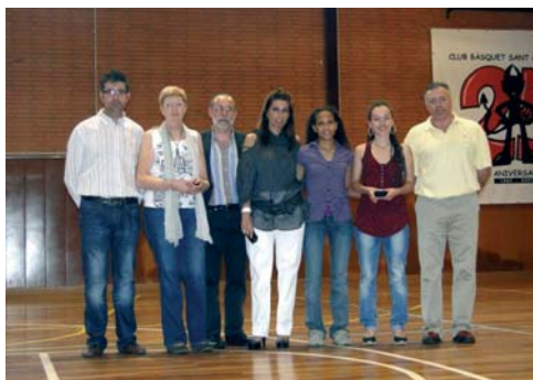
Club Patí Sant Celoni (Patinatge artístic), equip Grup de Xou conjunts. Campiones de Barcelona, subcampiones de Catalunya i d'Espanya i 5nes d'Europa. Classificades pel mundial de Portugal, al novembre