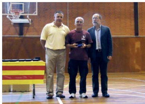
Club Amics Tennis Taula, equips Dobles, Veterans i Sènior. Campions de Catalunya (Dobles). Ascens de categoria (Sènior i Veterans)