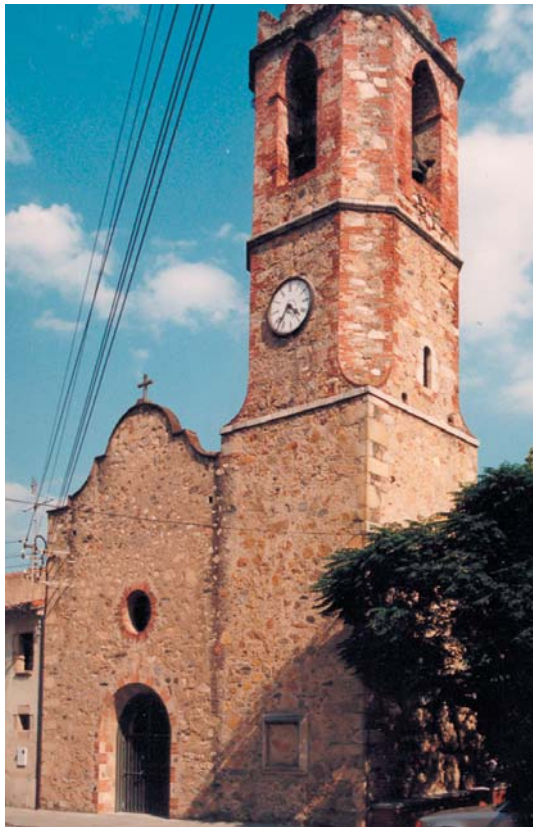
Façana de l'església de la Mare de Déu de l'Esperança