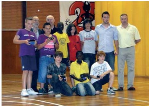
Club Esportiu Sant Celoni, equip Aleví de Futbol 7. Campions de lliga (grup 5), i ascens de categoria