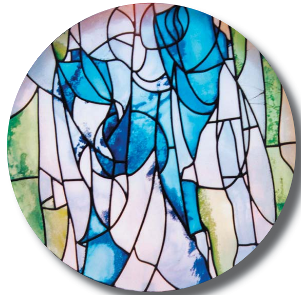
Vitrall del rosetó de la façana, obra de Joan Vila Grau