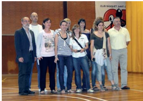
Club Bàsquet Sant Celoni, equip Sènior femení. Subcampiones de lliga (3a divisió), i ascens de categoria