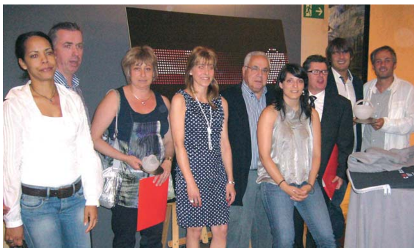
Els premiats amb els representants de l'ajuntament