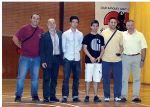
Unió Deportiva Pitres. Subcampió de lliga (3a territorial, grup 9) i ascens de categoria