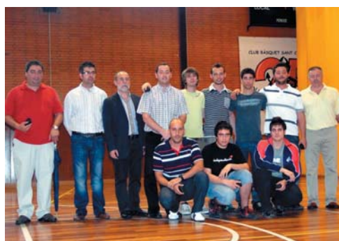
Club Patí Sant Celoni (Hoquei), equip Sènior masculí. Campions de lliga (2a catalana, grup B) i ascens de categoria