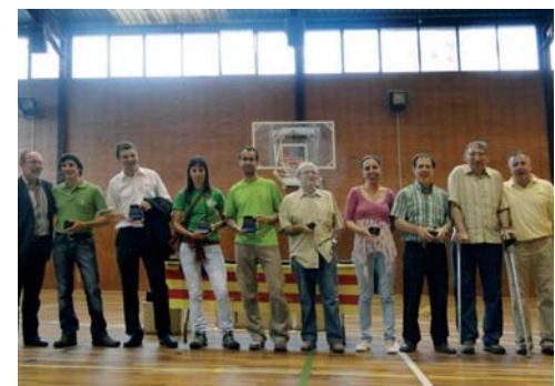
Centre Excursionista Sant Celoni Expedició que va coronar el Tocllaraju (Perú, 6.036 m.)