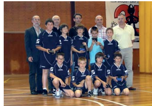
Club Esportiu Sant Celoni, equip Benjamí. Subcampions de lliga (segona divisió, grup 9)