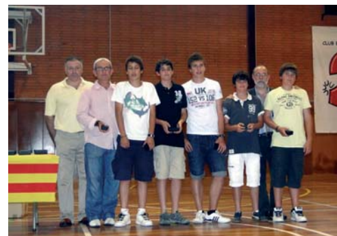
Club Tennis Sant Celoni, equips infantil, cadet i júnior masculí. Campions de Catalunya (júnior) i subcampions (infantil i cadet) per equips. Bronze al trofeu Luís Arilla (júnior)