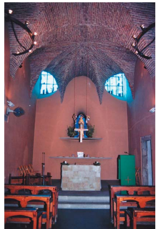
Interior del temple des del cor i des de baix, amb l'altar major i la volta de maó