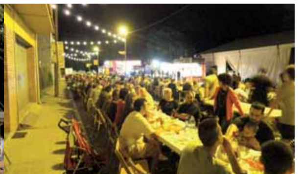
Cada vegada més els veïns i veïnes de la Batllòria, i rodalies gaudeixen més del Sopar popular. Aquest any es van vendre tots els tiquets, més de 330 persones hi van assistir.