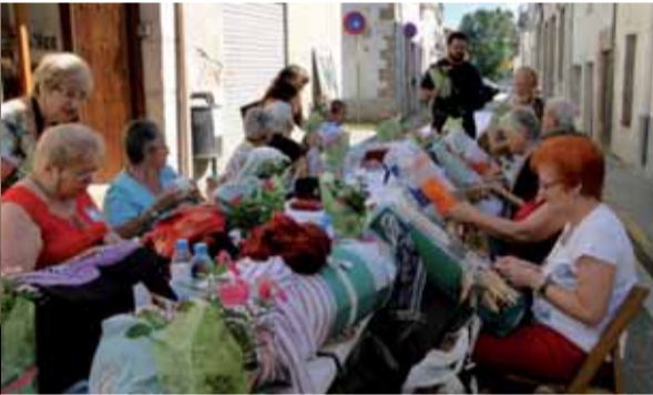
"Amb molta paciència!" diuen les puntaires quan parlen de la seva feina. Els curiosos queden embadalits de les obres d'art que s'exhibeixen.