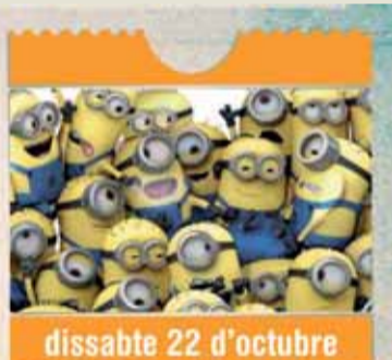
Gru, el meu dolent preferit