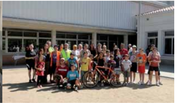
Aquest any la bicicletada de la Festa Major va comptar amb la col·laboració de l'Observatori de la Tordera, i es va fer un recorregut fins a l'aiguamoll de les Llobateres.