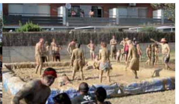
És el segon any que aquesta activitat formava part de la Festa Major i ja compta de grans especialistes a embrutar-se de fang fins les celles. Bon ambient, rialles, moltes ganes de gresca i passar-ho bé són les principals aptituds per participar-hi.