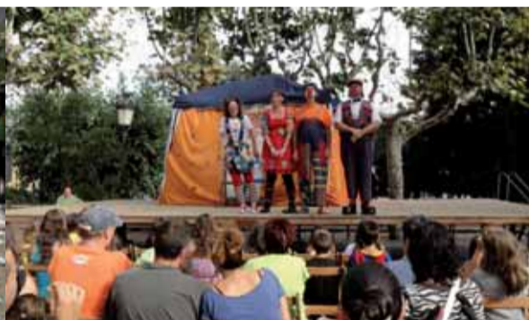
Acabats de tornar de l'últim projecte de cooperació al Salvador, l'entitat Trup de nassos va fer riure a grans i petits, alts i baixos, els quals omplien la plaça de l'església.