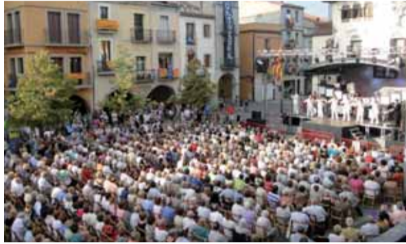
La plaça de la Vila es va vestir de gala com si fós un gran teatre! I es va omplir de gom a gom per assistir al concert i ball de l'orquestra Meravella, i posteriorment pel Fi de Festa.