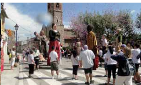
El diumenge al migdia els gegants de la Batllòria van lluir les seves millors gales. Les colles convidades van gaudir de la presència de grans i petits que omplien els carrers, tot i ser un dia calorós.