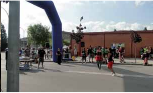
L'últim dia de Festa va començar amb la Cursa de les ermites, seguidament la rucada i l'estirada de corda, darreres proves del Corremonts.