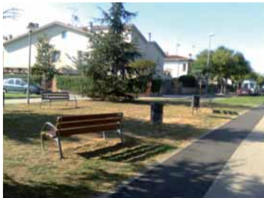
Passeig del Pertegàs

Durant l'estiu s'ha renovat o incorporat 40 nous bancs a diversos indrets del municipi. Entre els punts més significatius per nombre d'unitats, podem destacar les places properes al carrer de Mossèn Cinto Verdaguer i Lluís Companys, passeig Francesc Fullà, zona de dalt de la plaça Rafael Ferrer, pati de l'escola Montnegre, carrer de la Creu Roja i zona de ponent del Turó de la Mare de Déu del Puig.