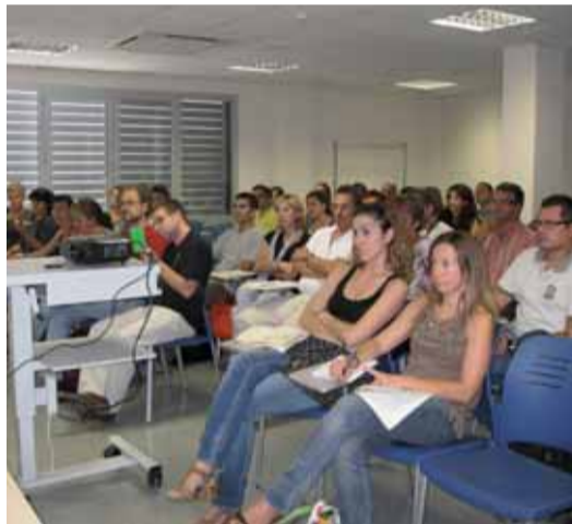
Una cinquantena de botiguers van participar al taller

Més d'una cinquantena de botiguers van participar el 22 de setembre a un taller per aprendre a promocionar el propi negoci des de les xarxes socials i altres eines d'Internet. Durant la sessió es van donar les claus per promoure productes a través del cercador Google i les xarxes socials o per convertir una empresa petita en global gràcies a Internet. Aquest taller organitzat per l'Ajuntament es va portar a terme, en el marc del programa modernitza't, gràcies al suport de la Diputació de Barcelona i de la Cambra de Comerç de Barcelona.