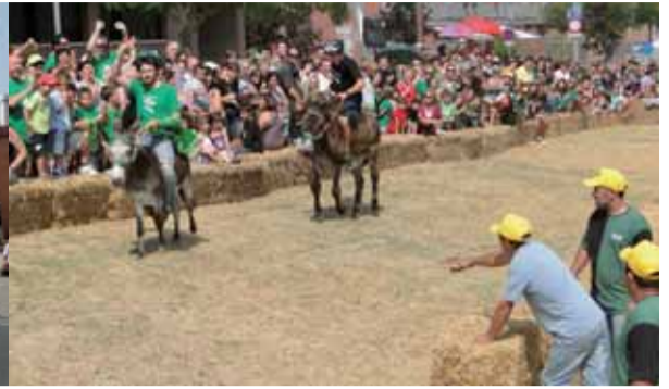
Enguany el dilluns de Festa Major va ser el dia de la Rucada, això potser va fer que no hi hagués molta gent, però el que hi eren van gaudir de les habilitats dels Senys i dels Negres a dalt dels burros. I els més petits de casa van poder fer una passejada amb els burros durant la Rucada infantil.