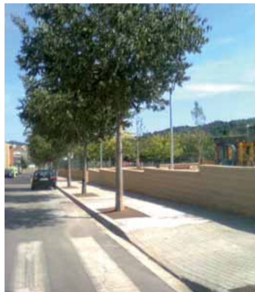
Carrer Joan Minuart

Tal com s'ha fet en altres indrets de municipi on l'amplada de les voreres ho permet, s'han ampliat recentment els escocells del carrer de Joan Minuart que s'havien deteriorat per acció de les arrels dels lledoners. Obrint els escocells, els arbres poden rebre més aportació d'aigua superficial i les arrels perden la tendència a pujar cap a nivell del paviment cercant humitat. D'aquesta manera, els arbres es poden desenvolupar amb més naturalitat i es minva l'efecte negatiu de les arrels sobre la vorera.