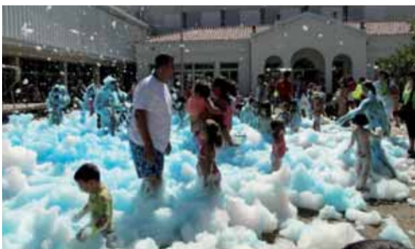
Després de la Bicicletada, a tothom li va venir de gust ballar al ritme de la música i omplir-se d'escuma per tot el cos.