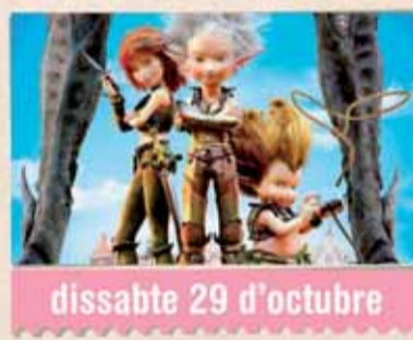
Arthur i la guerra dels mons