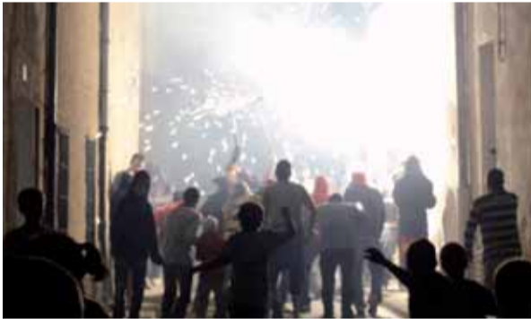
No seria Festa Major si no hi hagués el correfoc! Els joves de la Batllòria van gaudir de valent amb el ritme dels timbals i amb els salts de la Colla de Diables de Sant Celoni.