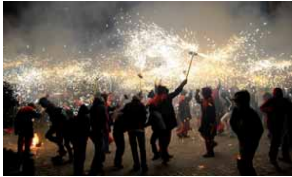
Com ja porten fent aquests últims anys, la Colla de Diables de Sant Celoni ens van tornar a deixar bocabadats amb un correfoc gran pels carrers del centre de la vila.