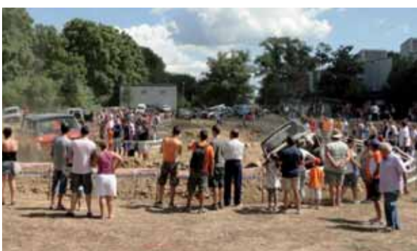
El dissabte, tot el dia, i el diumenge al matí, els amants de l'olor de benzina i de l'espectacularitat de la conducció dels vehicles 4x4 van gaudir amb les habilitats dels participants.