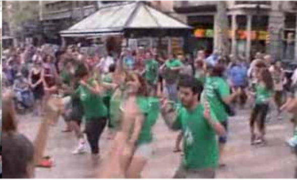
Els Negres i els Senys han posat tot l'enginy per crear els flash moves, on d'una situació quotidiana al carrer de cop i volta sonava una música i tots els participants es posaven a ballar una mateixa coreografia.