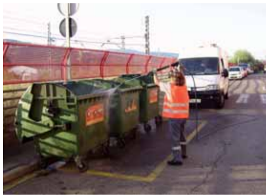
Equip en plena feina

Durant el mes d'agost s'ha fet una neteja específica de taques produïdes per xiclets al carrer Major, entre Sant Martí i plaça del Bestiar, que ha suposat una notable millora.