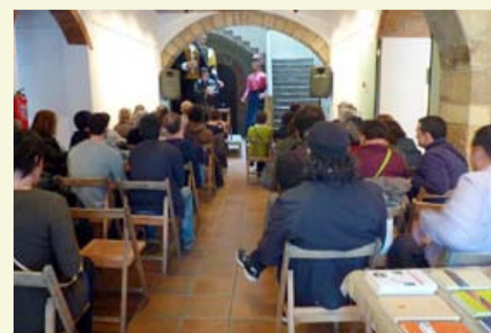
II Festival de Poesia

- I divendres, 28 de juny, al vespre, Tastets d'Estiu , a la plaça de la Vila