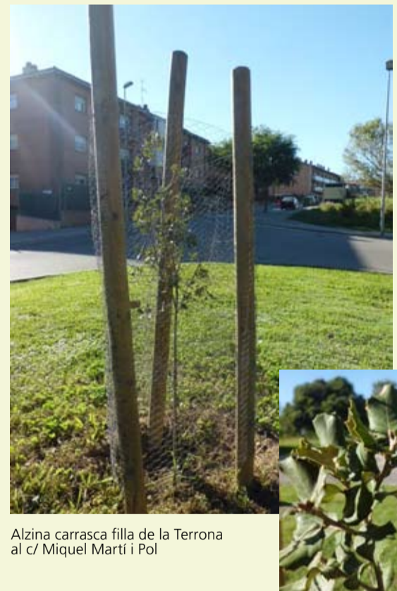
Alzina carrasca filla de la Terrona al c/ Miquel Martí i Pol

Alzina filla de la Terrona. Dins el projecte del viver, la primavera passada es va trasplantar a la zona verda del carrer Miquel Martí i Pol (davant l'antic pas inferior de la carretera de Gualba) una alzina carrasca filla de la Terrona, l'exemplar d'alzina carrasca considerat el més vell del món, amb una edat estimada de 800 anys. Properament s'hi instal·larà també un plafó informatiu.