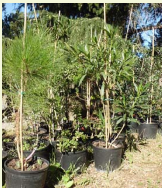
Viver d'arbres amb ascendents monumentals de Vilardell

monumentals. Aquest any 2013, el viver s'ha traslladat al jardí de Sant Llorenç de Vilardell, s'ha reinventariat i s'ha contractat un manteniment a través de la Fundació Acció Baix Montseny. Així mateix, aquest any 2013 s'han cedit dues col·leccions completes d'aquests arbrissos a Món Sant Benet i al municipi de Cabriels.