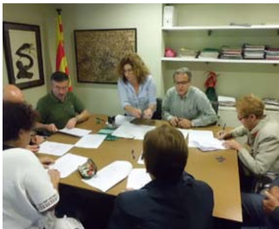
Acte de signatura dels contractes d'arrendament amb els propietaris dels quatre habitatges

Per a la provisió d'aquests habitatges, l'Ajuntament va fer un procés de contractació obert a tots els propietaris que va acabar el 30 de juliol passat. Els habitatges havien de complir un seguit de requisits entre els quals, estar al nucli urbà i un lloguer anual màxim de 3000 euros. En el marc del programa Lloguer segur, els propietaris obtenen garantia de cobrament, ús adequat i pacífic de l'habitatge i assegurança multirisic.