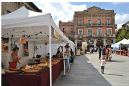
La fira de productes alimentaris artesanals amb una vintena de parades va suposar un bon tret de sortida per a la Tardor gastronòmica