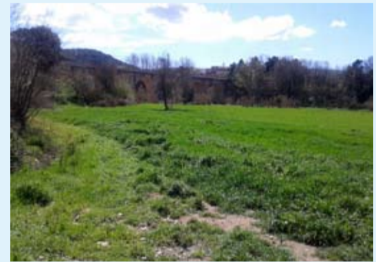
Terreny on es construirà el circuit, al Sot de les Granotes

Actualment s'està perfilant el model de col·laboració per a la gestió de l'equipament, element fonamental pel seu bon funcionament i la seguretat en l'ús.