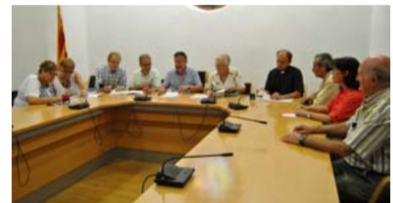
Acte de signatura del conveni, el passat 4 de setembre amb representants de les quatre entitats socials