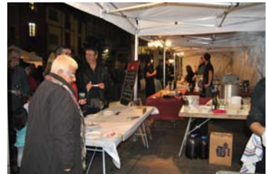
10 establiments celonins van oferir les seves creacions culinàries a la Mostra de tapes i platets de tardor a la plaça de la Vila que va servir 1500 tapes