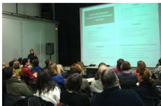
Més de 60 professionals van participar a les jornades els dies 16 i 23 de gener

Es preveu continuar aquesta formació inicial amb la creació de grups de treball del professorat, serveis educatius i agents educatius del Pla Educatiu d'Entorn per tal d'implementar accions directes de millora a l'aula i en el treball amb les famílies, acompanyades de processos de reflexió per millorar l'eficàcia i eficiència d'aquestes accions.