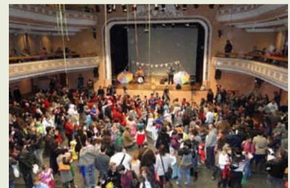
El diumenge dia 2 a la tarda es va celebrar el ball de disfresses infantil a l'Ateneu, amb un espectacle d'animació musical en directe que va fer ballar i gaudir a petits i grans.