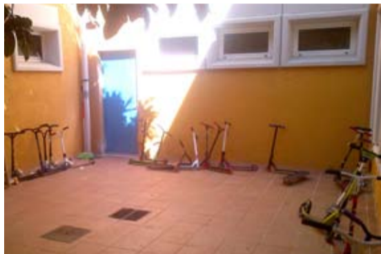
Dins les actuacions de millora dels equipaments educatius, s'ha enrajolat el pati interior de l'escola Pallerola