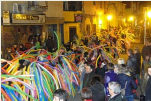
La comparsa Tribu es va endur el premi a la comparsa més original de la rua de Sant Celoni, amb 60 components guarnits amb vistoses disfresses. Enguany la rua va sortir de la plaça de la Creu.