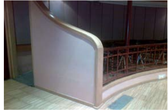
A la Sala gran de l'Ateneu s'hi ha fet obres de manteniment per evitar les humitats.