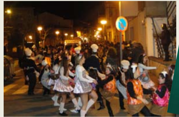
Els 115 components de Els Cup Cakes es van emportar el premi a la comparsa més animada. A la rua no hi va faltar la carrossa del rei Carnestoltes amb els personatges de Bocs i Cabres.