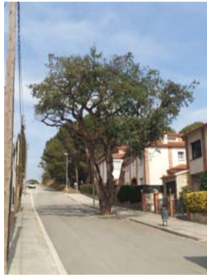
Suro del carrer Eduard Domènech