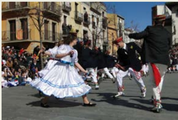
146 balladors de la Colla del Filferro i 197 de la Colla del Ferro, 28 músics, diablots, cavallers, presentadors... van fer gaudir la plaça amb el tradicional Ball de Gitanes. A la imatge, la Jota a càrrec de la Colla del Ferro.