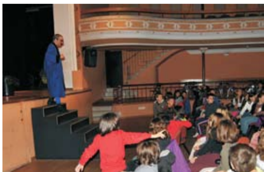
Més de 400 escolars a l'Ateneu a l'espectacle de màgia organitzat per l'Àrea de Seguretat Ciutadana

Més de 400 escolars de tercer i quart de primària de totes les escoles de Sant Celoni van assistir el passat 7 de març a l'Ateneu a l'espectacle de màgia Traspatràs. Es tracta d'una activitat organitzada per l'àrea de Seguretat Ciutadana com a complement a la tasca d'educació viària que du a terme la Policia local . Es van fer dues sessions, conduïdes per un Clown, que mitjançant la màgia, la música i les figures de globus va tractar tant aspectes relatius a la seguretat viària (utilització de casc, cinturó, semàfors, com creuar un carrer...) com aspectes de comportament cívic (no llençar coses al terra, reciclar materials, comportament amb animals domèstics...).