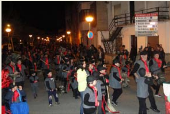
Mary Poppins va guanyar el premi a la comparsa més elaborada; a més, va ser la més nombrosa, amb ni més ni menys que 139 membres. La rua va aplegar un total de 12 comparses i més de 800 participants.