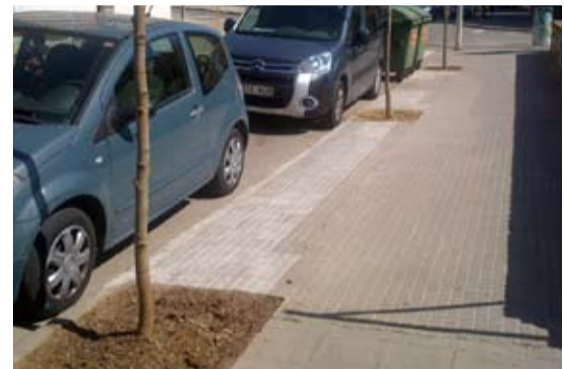
A l'avinguda de la Pau, s'han fet els escocells dels nous arbres que es van plantar durant el mes de gener.