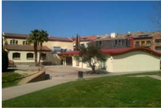
S'ha rentat la cara de la façana de la Biblioteca l'Escorxador.