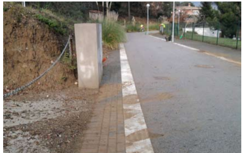
Neteja a Can Sans

El reforç en la neteja viària a través de la contractació de nou persones durant 5/6 mesos amb plans d'ocupació ha permès augmentar la neteja de zones amb baixa freqüència del servei, com Can Sans, Royal Parc o el polígon Molí de les Planes. Així mateix, també s'ha treballat en l'eliminació d'herbes en voreres i escocells. Tot plegat ha permès a l'empresa CLD, adjudicatària del servei de neteja viària, realitzar una rentada extraordinària dels contenidors de totes les àrees d'aportació amb aparells d'hidropressió.