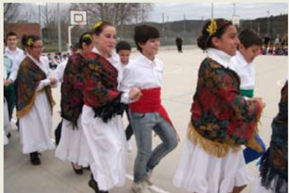
L'alumnat de 3r, 4t, 5è i 6è de primària de l'escola Montnegre van aprendre a ballar gitanes dins el currículum d'educació física i, el dijous 27 de febrer a la tarda, van fer la ballada oberta a tots els pares i mares de l'escola.