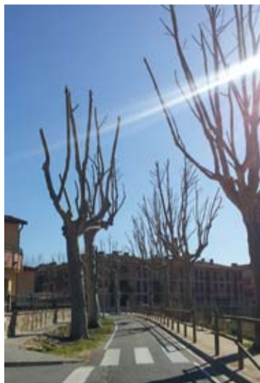
Poda de plàtans a la Batllòria

Aquest any també s'ha fet una poda i aclarida al Suro del carrer Eduard Domènech, un arbre considerat singular per les seves dimensions, port i particularitats. Els darrers anys aquest arbre ha patit greus afectacions de pugó i negreta, molt molestes pel veïnat. Aquesta aclarida, i la vigilància i tractament fitosanitari immediat en cas d'aparició de la plaga, ha estat la solució tècnica proposada pel Servei de Medi Natural de la Generalitat de Catalunya per fer compatible la preservació de l'arbre amb els veïns.