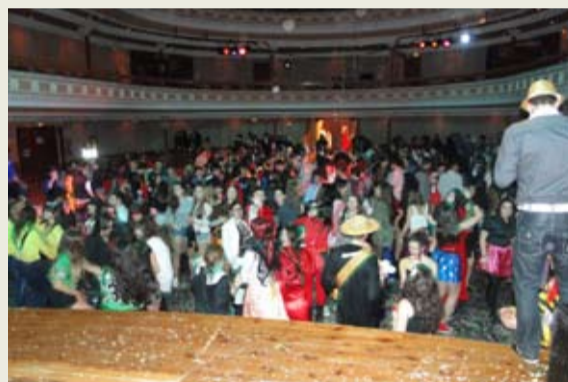
El jovent va poder reunir-se al ball de disfresses a l'Ateneu amb DJ el dissabte dia 1 al vespre. Es van vendre més de 500 entrades.