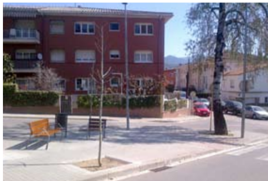
Intervenció a la plaça Eduard Domènech que estrena bancs i s'han refet els escocells