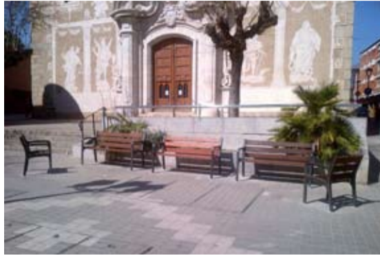
La plaça de l'Església ha estrenat bancs nous. A d'altres punts del municipi, s'han fet feines de manteniment del existents.