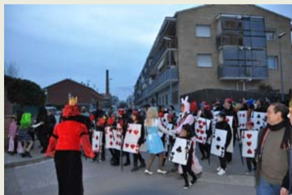
Una nombrosa i animada comparsa a la rua de la Batllòria va recrear el món d'Alicia al País de les Meravelles amb unes disfresses molt elaborades. Després de la rua, van fer una desfilada, sopar i ball.