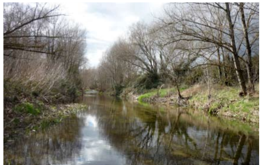
La Tordera a l'alçada de la desembocadura de la riera de Fuirosos