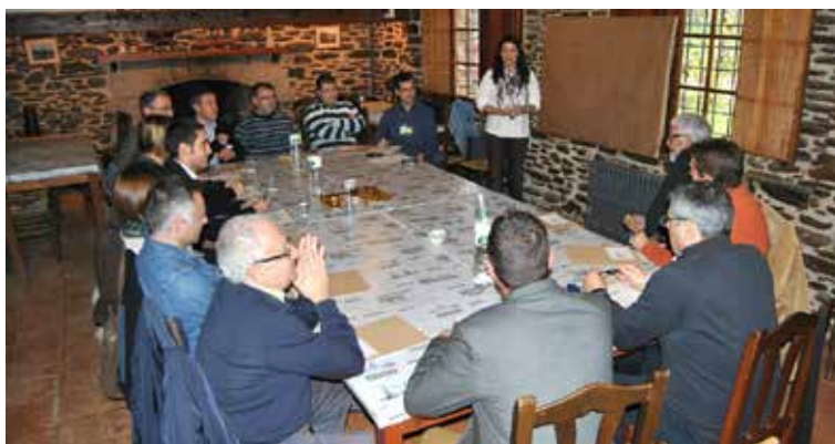
La jornada es va estructurar en diferents grups que van treballar la millora i ampliació dels serveis i la constitució de la comarca

La trobada d'enguany repren els compromisos del 1r Manifest municipalista del Baix Montseny signat el 22 de novembre de 2008 pels alcaldes i alcaldesses de 16 municipis: Arbúcies, Breda, Campins, Fogars de Montclús, Gualba, Hostalric, Llinars del Vallès, Montseny, Riells i Viabrea, Sant Antoni de Vilamajor, Sant Esteve de Palautordera, Sant Celoni, Sant Pere de Vilamajor, Santa Maria de Palautordera, Vallgorguina i Vilalba Sasserra.