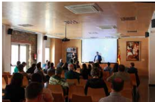
La jornada tècnica Els boscos. On som i cap on anem va comptar amb la participació de grans especialistes en la matèria.