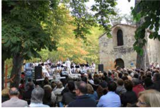
Molt ben rebuts els 5 concerts i espectacles dedicats al nostre entorn i, en alguns casos inèdits, com el concert 'Sona a Bosc' o l'Orquestra del Bosc', tots ells amb músics i artistes del Baix Montseny.