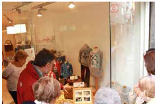
82 comerços del municipi van formar part de la iniciativa Els comerços es vesteixen de bosc exposant la col·lecció de Forest Art: Desemboscant , de Martí Boada, i la col·lecció Arbres del Montseny i Montnegre .