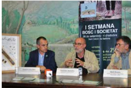
A l'acte de presentació els organitzadors van situar I Setmana Bosc i Societat en el marc del projecte de creació del futur Museu Europeu del Bosc (MEdB) a Sant Celoni.

La primera edició de la Setmana Bosc i Societat va omplir Sant Celoni d'activitats molt diverses per divulgar i apropar el bosc i els seus usos a la societat. La Setmana, organitzada pel Cercle Econòmic i Social Baix Montseny, l'Institut de Ciència i Tecnologia de la UAB i l'Ajuntament va programar del 26 de setembre al 4 d'octubre, més de 25 activitats sobre el món forestal des de perspectives ben diverses com són la cultural, l'econòmica, la social, la gastronòmica i l'ambiental. Un cop celebrada la Setmana, els organitzadors ja pensen en la segona edició.