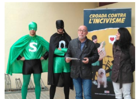
A la presentació també hi van assistir representants de la comissió que treballa amb la campanya de les àrees d'Espai Públic, Seguretat Ciutadana i Comunicació amb la col·laboració puntual d'Educació, Serveis Socials i Sostenibilitat.