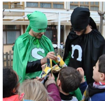
Els Supermunts van anar a les escoles a presentar la campanya i van ser molt ben rebuts!