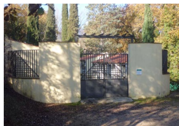
Cementiri de la Batllòria