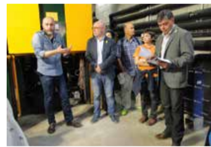
Inauguració de les Calderes de l'Escola Pallerola

L'Ajuntament de Sant Celoni aposta per la biomassa com a font d'energia renovable en substitució del gas i es treballa amb l'objectiu d'implantar-la a d'altres equipaments pels seus beneficis ambientals, socials i econòmics. Des d'aquest curs 2017/2018, la biomassa és la font d'energia per la calefacció i l'aigua calenta a les escoles Josep Pallerola i Soler de Vilardell i des del 2012 del Centre de Dia Indaleci Losilla. Això vol dir que el 13% de la potència que es necessita per la calefacció i aigua calenta en equipaments municipals a Sant Celoni ja és d'origen forestal (estella de fusta).