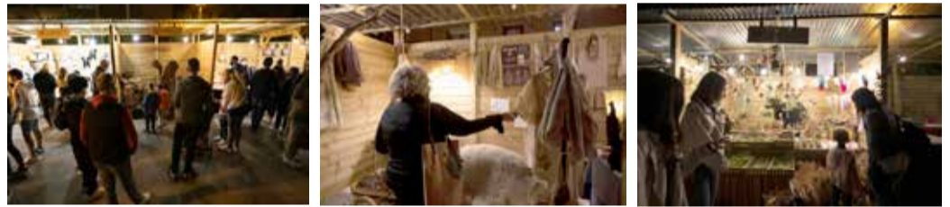
Tallers familiars i jocs infantils