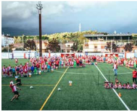
Acte de presentació de la temporada del FC Sant Celoni: 26 equips, 372 jugadors i 60 personal tècnic