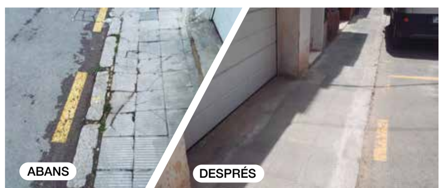
Reposició puntual del paviment al carrer de Sant Roc