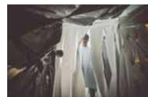
Túnel del terror amb AEIG Erol