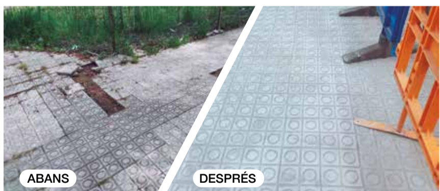
Reposició puntual de paviment al carrer Lluís Companys