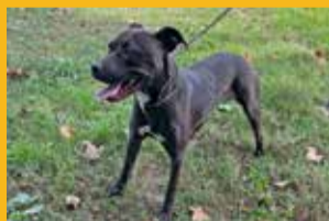
Nom: Patty Sexe: Femella Edat: Adulta Mida: Gran

Podeu anar a veure els gats i gossos que esperen una família que els adopti al centre caní i felí Can Clarens de Vallgorguina, tel. 93 707 44 12