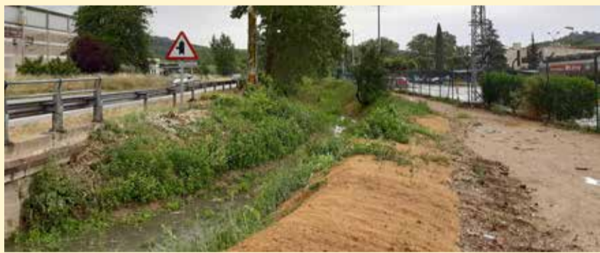
Torrent de Telleda