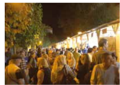
Fira del Bosc a la Rectoria Vella amb venda de productes, activitats, tallers, exhibicions, espai gastronòmic, espectacles i concerts