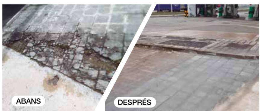
Reposició del paviment al carrer de Maria Aurèlia Capmany