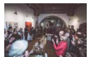
Inauguració de l'exposició Si ens rendim morirem