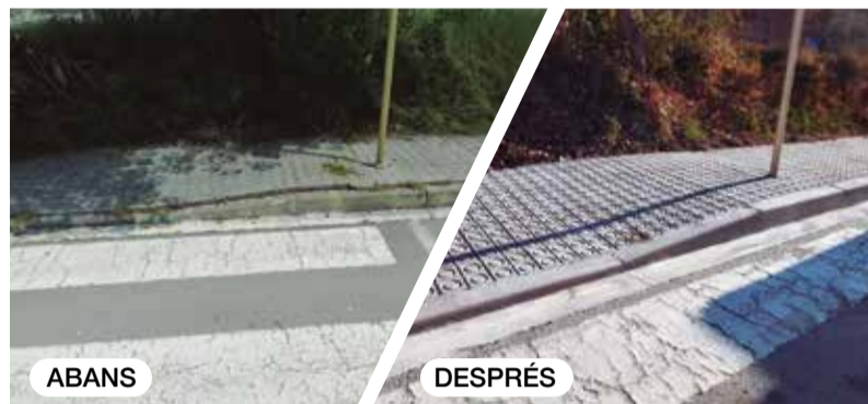
Reposició puntual de paviment al carrer de Breda de la Batllòria