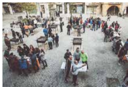
XXXVI Concurs d'Allioli i esmorzar popular