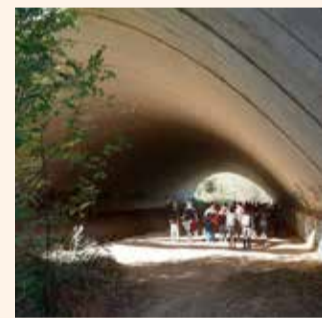
Alumnes de la UAB al pas de fauna de Maribaus

Des de la Universitat Autònoma de Barcelona s'ha consolidat una visita anual d'alumnes de 3r del grau de Ciències ambientals al territori de Sant Celoni. Un dels punts rellevants que analitzen, juntament amb un tècnic municipal, són les mesures correctores i compensatòries de la construcció del TGV (viaductes, túnels i passos de fauna). També visiten la desembocadura de la riera de Pertegàs, la Tordera al seu pas per la Batllòria i les Llobateres.