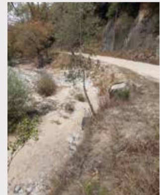
Camí de Fuirosos

Properament es reforçarà amb escullera un tram d'uns 50 metres de la pista principal de la vall de Fuirosos on l'aigua de la riera ha anat erosionant el marge del camí. S'han detectat altres punts crítics que es miraran de resoldre juntament amb el Parc del Montnegre-Corredor.