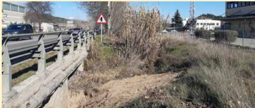
Torrent de Telleda abans de la millora