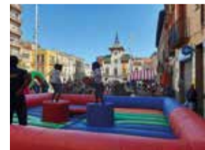
Jocs per a infants i famílies