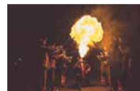
Espectacle de foc amb la Colla de Diables