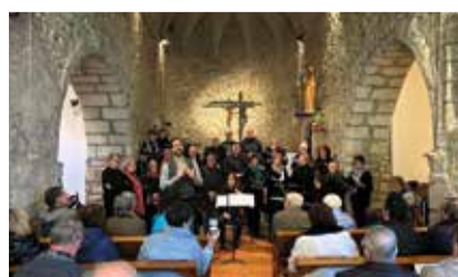
Concert de la Coral Briançó