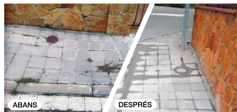
Reposició puntual de paviment al carrer de Josep Maria Sert