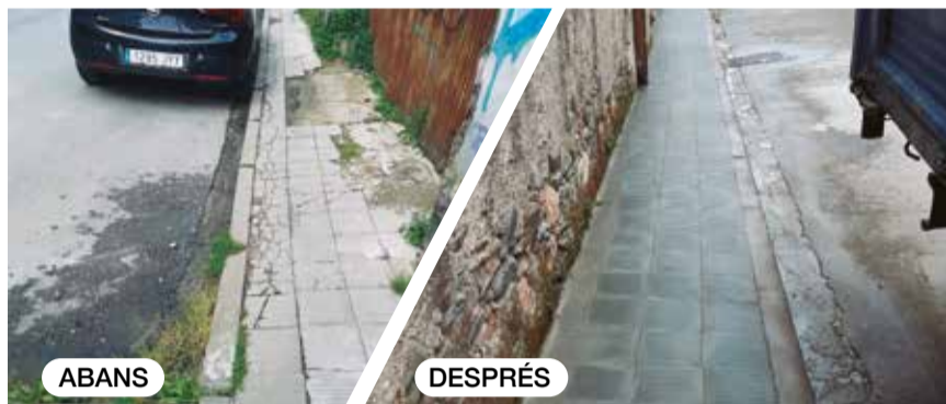
Reposició de paviment al carrer de Palautordera

L'Ajuntament ha posat l'accent en la millora de les voreres a molts punts del municipi amb el suport de la Brigada d'obres que prioritza aquestes actuacions del Pla de millora del ferm urbà. Aquests són alguns exemples dels darrers mesos