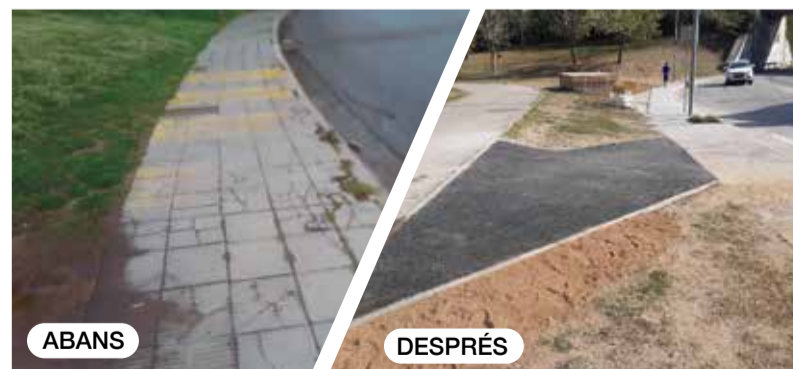
Reposició del paviment al carrer Bruc