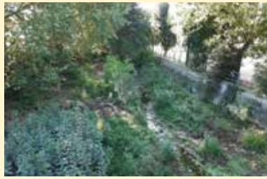
Riera de Pertegàs

Aquest 2022, després d'haver fet una millora substancial en el torrent de Telleda al seu pas pels polígons industrials on s'ha ampliat la seva secció, s'han retirat tones de sediments de la zona canalitzada, s'han construït dos sorres i s'ha fet una revegetació dels talussos, també s'han plantejat actuacions de manteniment en d'altres rieres i torrents urbans.