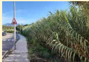
Torrent del Virgili