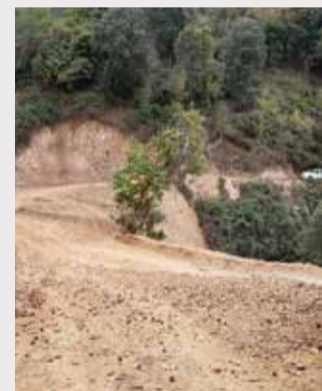
Camí de Montllorer