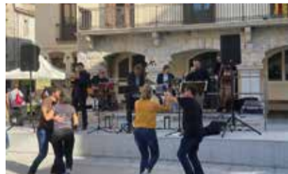
Vermut i swing