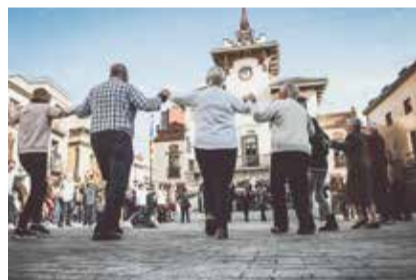
Audició i ballada de sardanes