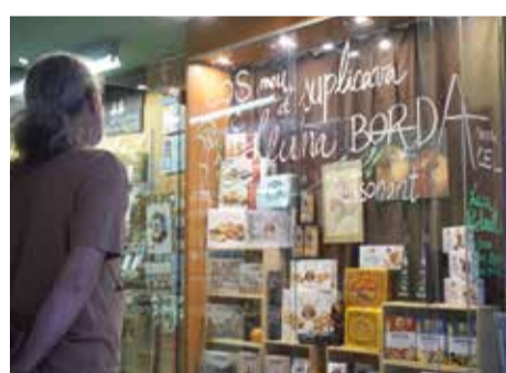
Més de 40 establiments participants a la segona edició de Brots de poesia als aparadors