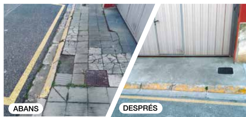
Reposició puntual del paviment al carrer de Palautordera