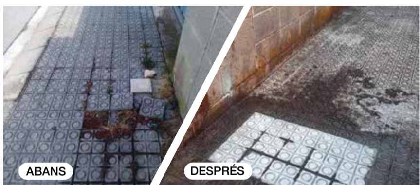
Reposició puntual del paviment al carrer d'Enric Granados