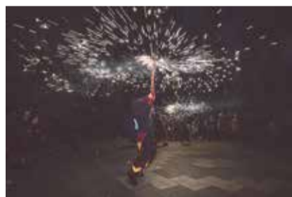
Correfoc amb les Espurnes del Montseny