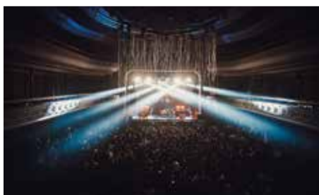
Concert de 31 FAM