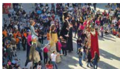
Cercavila de gegants amb la Colla de Geganters i les gegants de les escoles