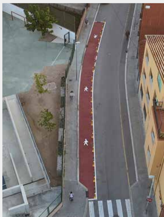
Accés a l'Escola l'Avet Roig

A l'Escola l'Avet Roig s'ha creat una zona de seguretat per l'alumnat i famílies davant el centre, suprimint tres estacionaments i senyalitzant els passos de vianants amb color blanc i vermell, i s'ha convertit a un sol sentit de circulació el tram del passeig de la Rectoria Vella entre Torras i Bages i Jaume I en direcció la Biblioteca. En aquest tram s'han habilitat vuit noves places d'aparcament.