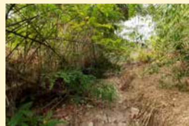
Torrent de Sot Gran