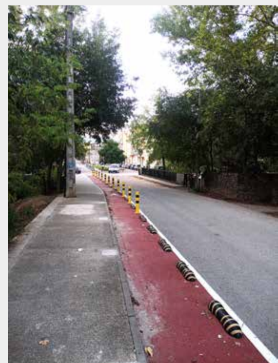
Accés a l'Institut Escola Pallerola