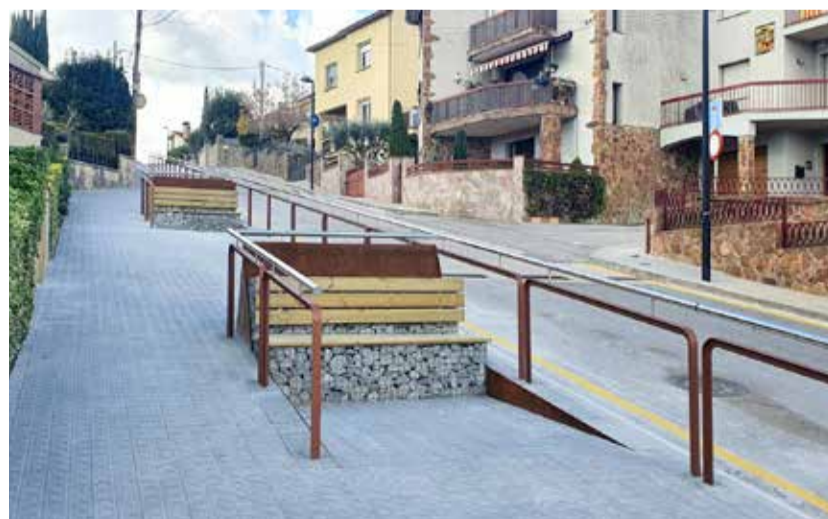
Carrer Ramon y Cajal