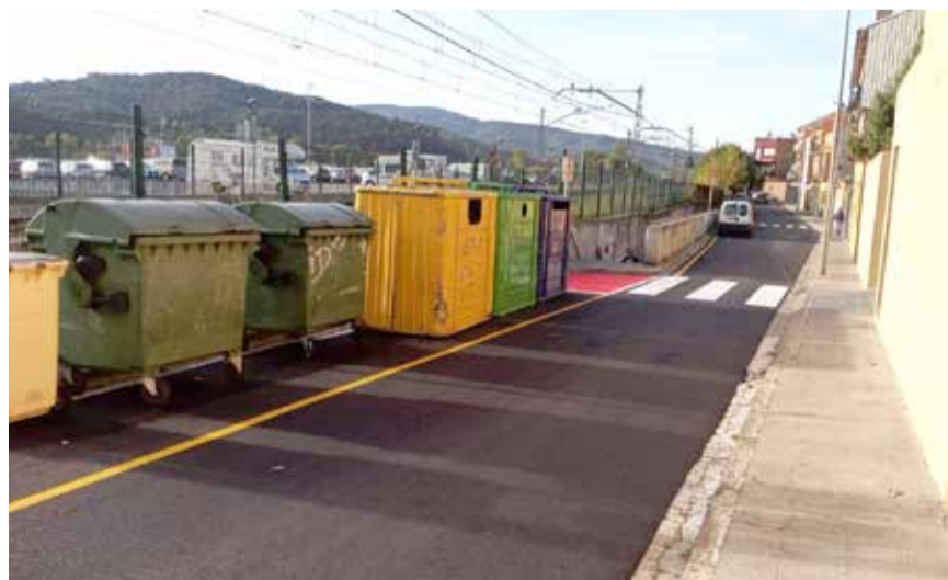
Carrer Sant Francesc