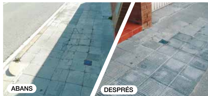
Reposició puntual de paviment al carrer de Girona