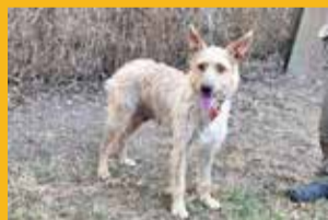
Nom: Falla Sexe: Femella Edat: Adulta Mida: Mitjana