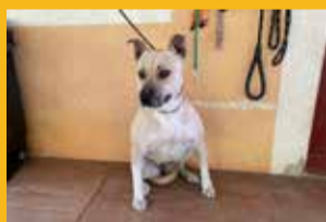
Nom: Tuba Sexe: Femella Edat: Adulta Mida: Mitjana