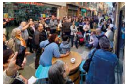
Visita teatralitzada al centre de la vila