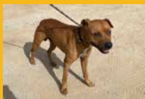
Nom: Apu Sexe: Mascle Edat: Adult Mida: Gran