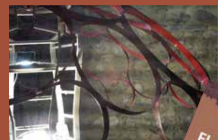
II El Bosc i els Sentits. Recorregut per 9 instal·lacions artístiques al barri de la Força i a l'arbreda del Pertegàs amb més de mil visitants