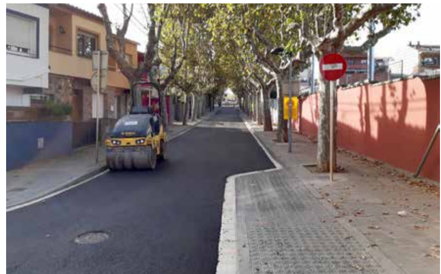
Passeig dels Esports

Durant el mes d'octubre s'ha fet una nova tanda de reasfaltatges a diferents punts del municipi. S'ha intervingut prioritant els punts on l'asfalt estava en pitjors condicions o d'alt nivell de trànsit.