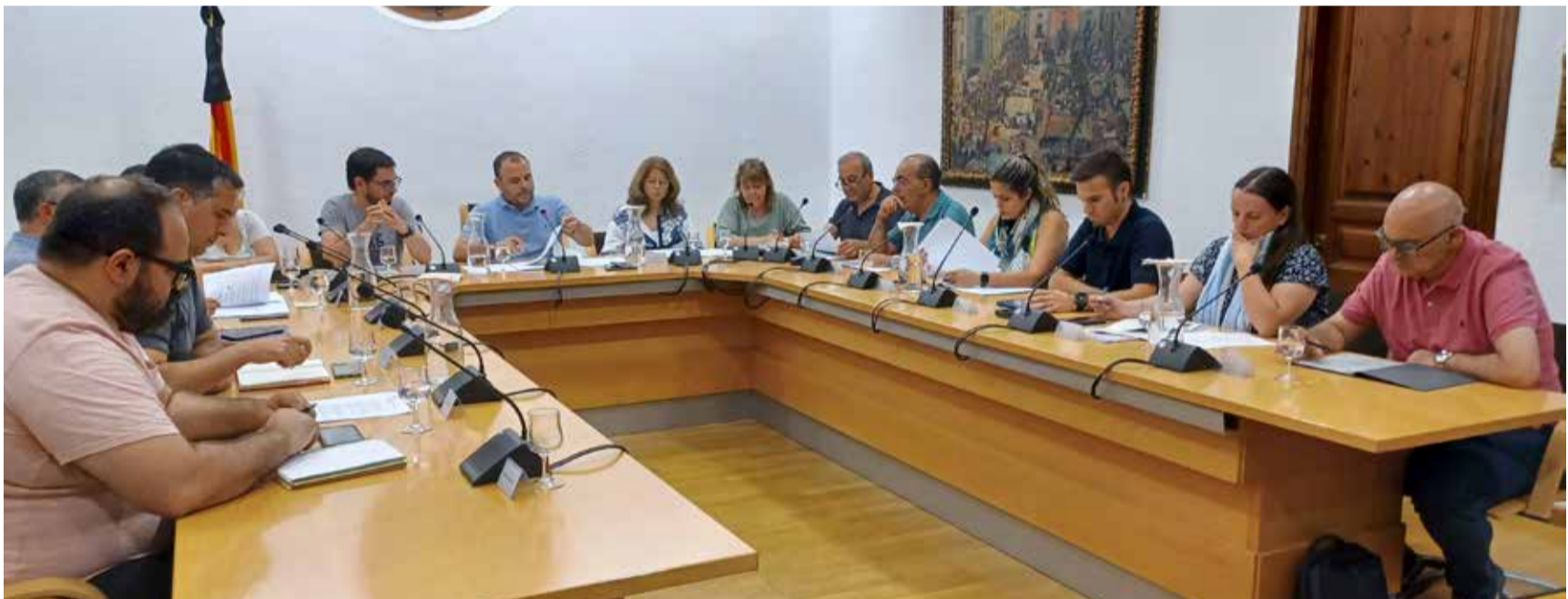
Primer Ple Municipal del nou consistori celebrat el 6 de juliol

L'acord es pot consultar a través d'aquest codi QR