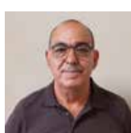
Josep Capote Regidor de Seguretat Ciutadana i Convivència